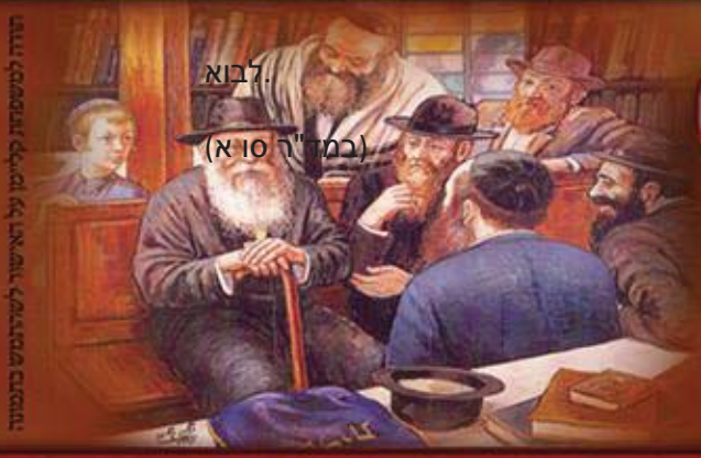
לבוא. (במד"ר סו"א)