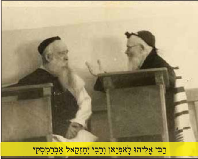
רבי אליהו לאפיאן ורבי יחזקאל אברמסקי

וסים, גם אני לא מצאתי עדין את הדרך, אבל מכיין שזקן אני, יכול אני לומר לכם מה לא לעשות, כדי שלא תתפשו בעצת היצור הרע.