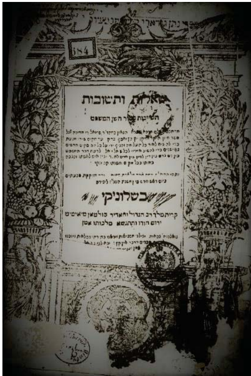
שו"ת מוהרשד"ם דפוס ראשון

או אז ראו כלם את גדל עיונו וחקמתו, ונתקימו דברי האר"י הקדוש שצפה עליו שיצא שמעו בחכמת העיון 1,2 .