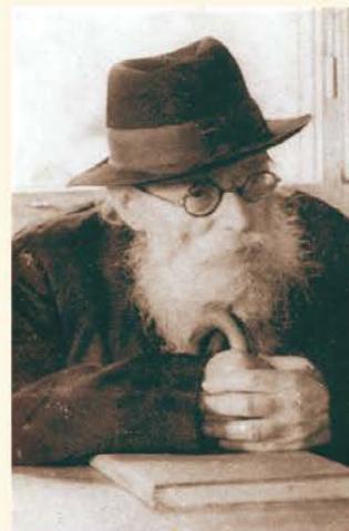
מרן הגאון רבי ישעיה קרליץ זיע"א בעל ה"חזון איש"

כשחזרתי הביתה, התפלאתי לראות כי דירתי כבר מוארת. תיכף כשפתחתי את הבית, נדהמתי והזדעזעתי: אבי המנוח שוב עומד מולי פנים אל פנים בדיוק כמו אתמול וחזר על אותם דברים, אך הוסיף: "דע בני, כי זו הפעם האחרונה שבאתי להזהיר אותך!..." ביום ראשון, נסעתי תיכף לבני ברק, אל בעל ה"חזון איש". רציתי לספר לו את כל החלומות, ואת העובדה שראיתי פעמיים את אבי המנוח בהקיץ. בדעתי היה