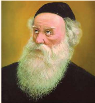
האדמו"ר הזקן רבי שניאור זלמן מלאדי זיע"א

ניסע הביתה לגמור את "המסחר" מכל וכל. כשהגיעו להכפר, נכנס אל הבית המלמד לבד, ואילו בעל הבית פשט את בגדיו ועמד בשלג עד צוארו, ואמר תהילים בדביקות נפלאה. קור גדול שרר אז ועל פי הטבע היה מהנמנע שיאמר כל התהלים וישאר בחיים. המלמד ישב בבית והשתומם, כי חשש שבדאי ימות קודם שיאמר חצי התהלים. בתוך כך באו אנשי הכפר ברעש גדול לבקש כמה מידות יי"ש לצורך קבורת בן ה"פריצה". הם סיפרו שהוא שפך על עצמו קדירה גדולה עם מים רותחים ותיכף ומיד הוא נפטר מכך. המלמד התרגש מאד, ורץ תיכף לראות מה נעשה עם בעל הבית וכן ביקש להודיעו מהמאורע.