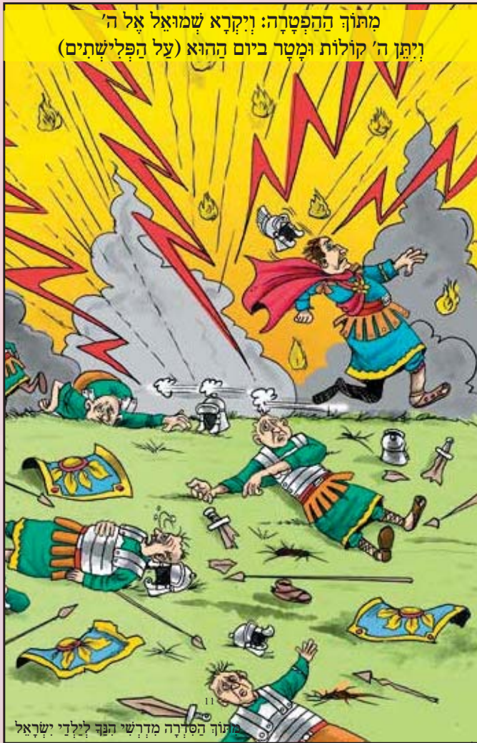
מתוך ההפטרָה: וַיִּקְרָא שְׂמוּאֵל אֶל ה' וַיִּתֵּן ה' קוֹלוֹת וַיִּמְטֵר בַּיּוֹם הַהוּא (על הפְּלִישְׁתִּים)