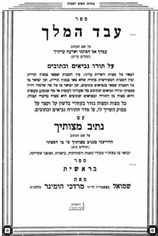
עבד המלך עמוד מס' 1 א (בראשית) הומבר, שמואל בן סרדכי זאב הוולפס ליי תכנת אוצר החכמה

ממש מפליא שאנשים שעשו ספרים בדומה לספרו קיצורי דינים על לשה"ר לא רק שלא היה כועס כלל אלא אף היה מעודד אותם בשמחה. בני המשפחה מציינים כי עוד בחייו נדפסו יותר מחמש עשרה מהדורות מהספר "עיקרי דינים" בארץ ובחו"ל, דבר המעיד יותר מכל על עוצמתו וחשיבותו של הספר.