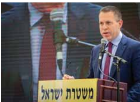
ואנרכיה "כן למחאה - לא לאלימות".

השר לביטחון פנים הבהיר: לכולנו יש אחריות על חיי אדם, אסור שתהיה אנרכיה ואלימות