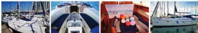
פינת שכיבה מפנקת בשמש | פינת שכיבה מפנקת בצל מלא | קישוט בלונים, חמנות למזכרת ושלת מזל טוב | הפלגות פרטיות על יאכטה מפוארת וזולה במרינה הרצליה

מתאים במיוחד לזוגות, ימי הולדת, ימי נישואים, פגישות מתקדמות