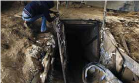
מאת: ישראל לביא

דובר צה"ל: "בניית המכשול התת קרקעי בגבול רצועת עזה חשפה תוואי מנהרה נוסף בדרום הרצועה • מהמועצה אזורית אשכול נמסר כי "צה"ל עדכן בדבר גילוי המנהרה"