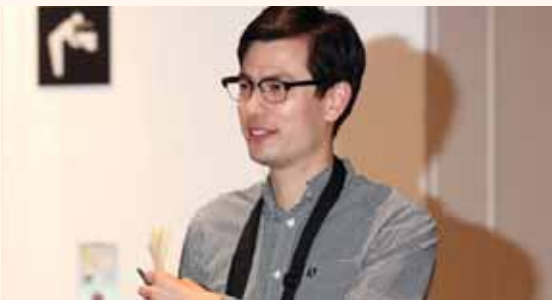
מאת פ. יוחנן

אזרח אוסטרלי שוחרר לאחר שנעלם באופן מסתורי במדינה המסוגרת ♦ שוחרר לאחר מאמץ דיפלומטי קדחתני