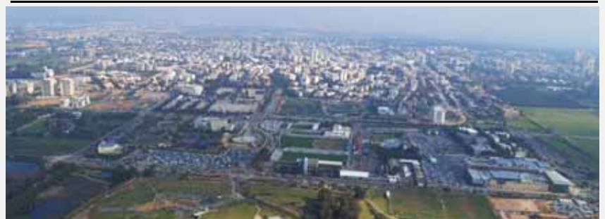
מאת פ. יוחנן

הוועדה הארצית לתכנון ולבנייה של מתחמים מועדפים לדיור הפקידה תכנית להקמת מתחם מגורים, תעסוקה, מסחר ופארק עירוני בהרצליה, במקום מתקן לטיהור שפכים