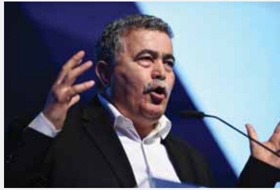
מאת: ת. פרנקל

בפגישה, סיכמו השניים להמשיך ולשמור על ערוץ תקשורת פתוח