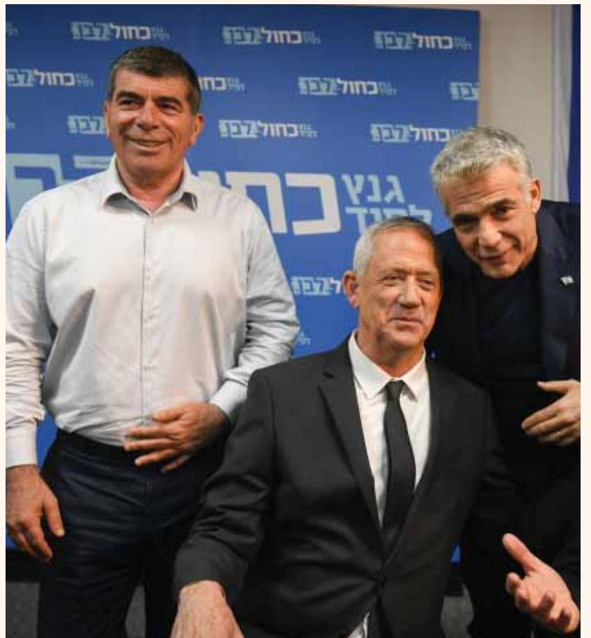
מאת: ת. פרנקל

בהקלטות שנחשפו אתמול נשמע מספר שלוש בכחול לבן כשהוא תוקף את הסכם הרוטציה בין לפיד לגנץ