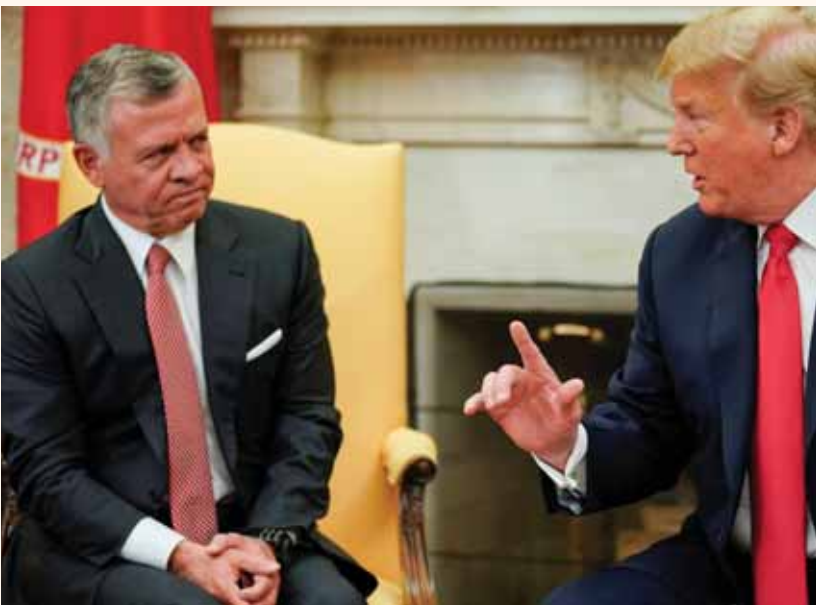
מאת אברהם יסמן

הצעד ייעשה במקרה שירדן תמנע מלתמוך בחלק המדיני של "עסקת המאה"