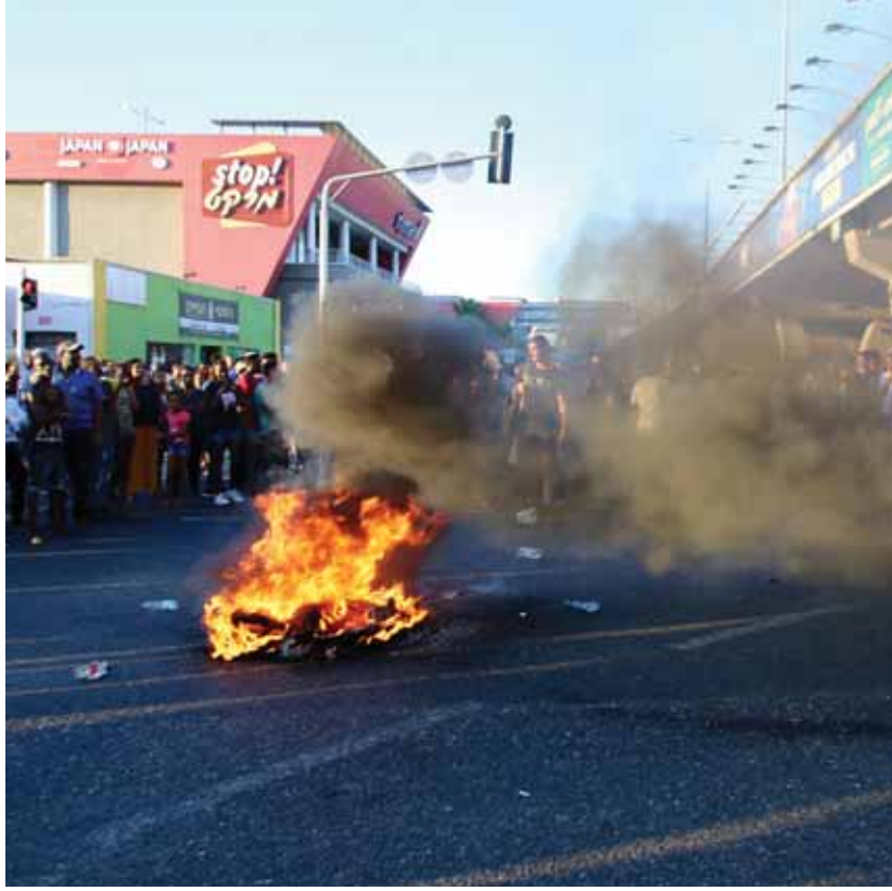
מאת: מ. יוד

שמייצגת מטעם הסניגוריה הציבורית את הצעיר אמרה כי: "מדובר בצעיר נורמטיבי הפור על ותורם רבות למען החברה. הצעיר הגיע להפגנה כמו אל- פים רבים כדי למחות על היחס והאפלייה כלפי יוצאי אתיופיה. באותו ערב היו מאוד מוקדים בהם התלהמו הרוחות והוא מצא עצמו עצור. הצעיר מכחיש את האישומים המיוחסים לו, לאחר שנלמד את חומרי החקירה נגיב בבית המשפט".