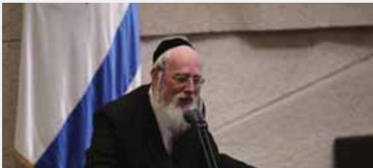
מאת: ת. פרנקל

בתגובה לאישור הפעלת התח"צ ברמת גן אמר הרב אייכלר כי "ראשי ערים מהליכוד עלו על גל האיבה נגד כל הקדוש והיקר"