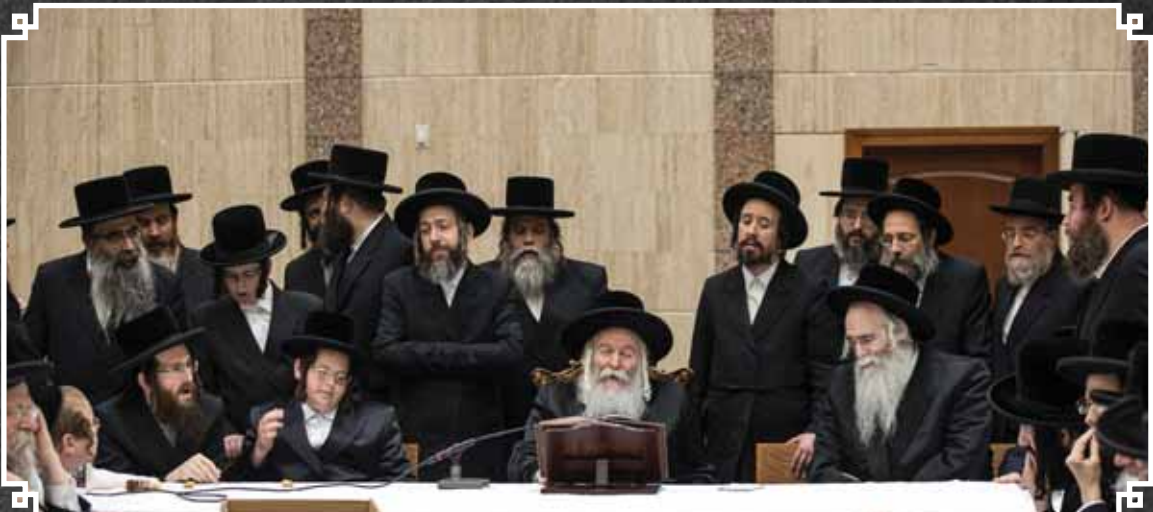
היכולת הרה"ק מהר"ש הראשון מבאבוב זי"ע אצל האדמו"ר מבאבוב במחנה כרם שלמה ד'באבוב בסאזט פאלסבורג