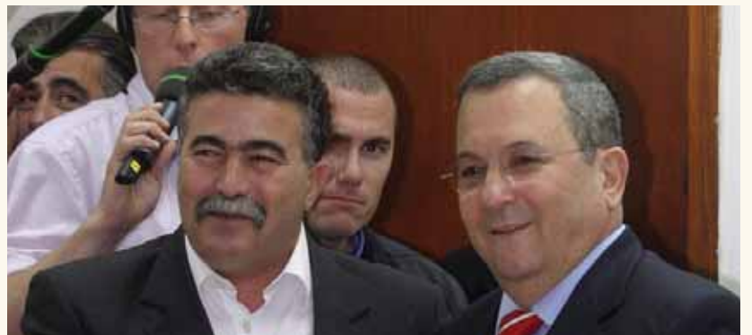
מאת: ת. פרנקל

בחשאיות ואף ללא תמונה משותפת, עמיר פרץ ואהוד ברק נפגשו אתמול ודנו על שת"פ אפשריים