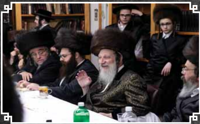
שמחת הבר מצווה לנכד האדמו"ר מהרי"ד מלעילוב