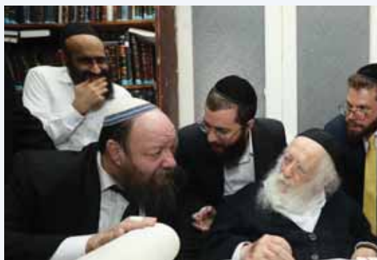
מאת: צבי קופמן

במהלך הביקור במעונו של מרן שר התורה הציג הרב קליין את המהפכות שנעשו במרכז הרפואי למניעת מכשלות של טומאת כוהנים ושמירת שבת באופן המהודר ביותר למען לא יצטרכו הבאים בשערי המרכז הרפואי להזדקק לקולות בעניינים אלו ועוד אחרים