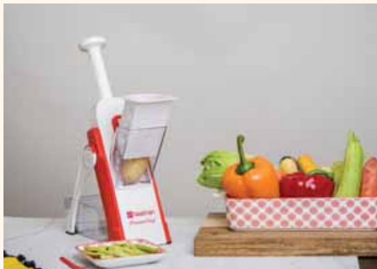
מאת: צבי קופמן

לנוכח ההצלחה שנרשמה בעת ההשקה בערב חג הפסח האחרון למוצר המהפכני, רשת כלי הבית 'נעמן' יוצאת שוב במבצע ענק אטרקטיבי ומשתלם על 'פרייבט-שף' - הפטנט הבלעדי שהפך לחובה בכל מטבח. ה'פרייבט-שף' הוא מוצר ייחודי המשמש למגוון פעולות קריטיות במטבח: גם קוצץ לרצועות דקות, גם לרצועות עבות, גם חותך לקוביות וגם פורס פרוסות בעוביים שונים.