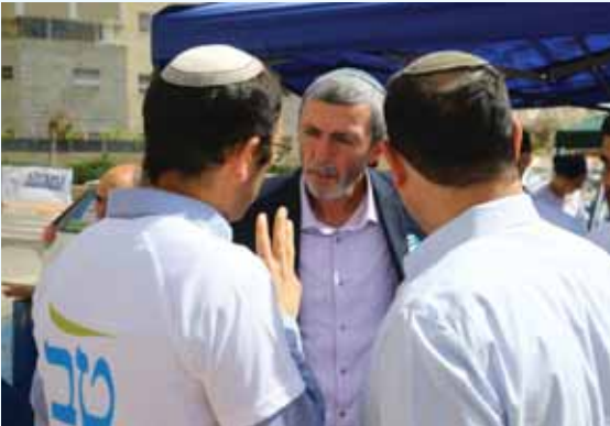
מאת: ח. פרוקל

בסביבתה של שקד זעמו על הגורמים מהבית היהודי שטענו כי לאחר הבחירות, תעזוב לליכוד • ביום ראשון נערכה פגישה בין הצדדים אך גורמים בבית היהודי טוענים: "צאנו כמו שנכנסנו"