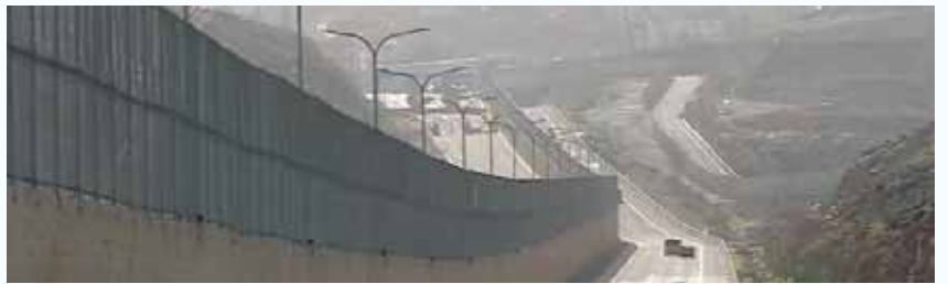
מאת: מ. יוד

כ-40 ק"מ נבנו עד כה במסגרת הפרויקט ההנדסי שנועד לסכל את המנהרות ההתקפיות של חמאס - יותר ממחצית מהתוואי המתוכנן • למרות ההישג המבצעי, במערכת הביטחון עדיין מעריכים כי הארגון מתחזק מנהרות טרור בגבול