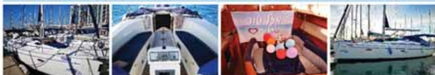
פינת שכיבה מפנקת בשמש | פינת שכיבה מפנקת בצל מלא | קישוט בלונים, חמנות למזכרת ושלת מזל טוב | הפלגות פרטיות על יאכטה מפוארת וזולה במרינה הרצליה

מתאים במיוחד לזוגות, ימי הולדת, ימי נישואים, פגישות מתקדמות