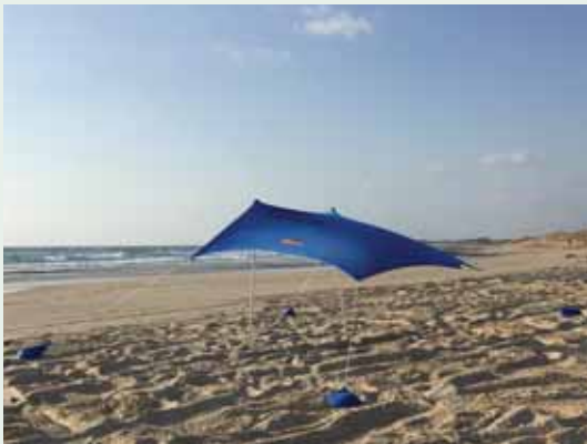
מאת פ. יחנן

גל חום קיצוני הורגש בכל רחבי ארה"ב, כשבניו יורק וערים נוספות הכריזו על מצב חירום • הטמפרטורות צפויות לשבור שיאים באזורים מסויימים