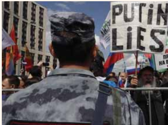
מאת פ. יחנן

אלפי מפגינים יצאו לרחובות כדי למחות על התנהלות הממשל לקראת הבחירות • 30 מועמדים, רובם מהאופוזיציה, נפסלו למרות שאספו את מספר החתימות הדרוש