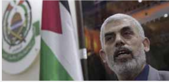
מאת: מ. יוד

הפרשן לענייני ערבים התייחס בתכניתו של ניסים משעל לסוגיית החטופים ברצועה ♦ הוסיף: "רק פעולה איכותית מול בכירי חמאס יכולה לשנות את המשוואה"