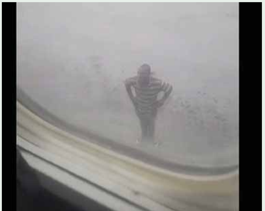
מאת פ. יחנן

אדם נעצר ונלקח לחקירה לאחר שקפץ על כנף מטוס שהחל בתהליך ההמראה • החשוד נכנס אל המנוע ואף ניסה להגיע אל תא הטייס