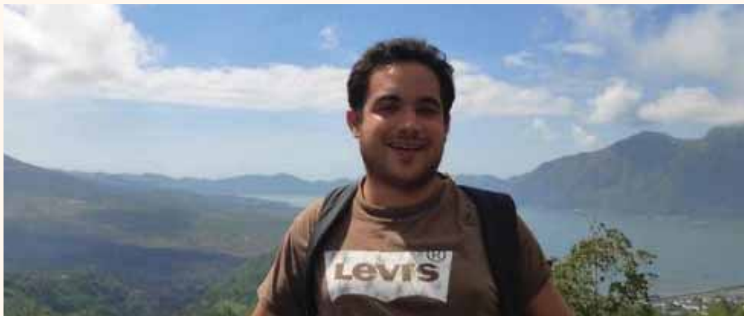
מאת פ. יוחנן

כחודש אחרי שהתקבלה ההודעה על היעדרותו, באינדונזיה הודיעו על הפסקת החיפושים אחרי אביב משל שנעלם • אחותו סיון: "אנחנו לא מוותרים"