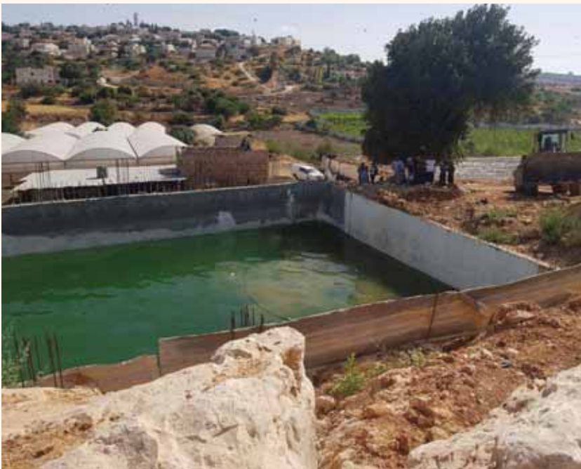
מאת: ישראל לביא

מבצע מאסיבי וממושך על מנת להביא לאכיפה מוגברת של מקרי גניבות המים מתוך כוונה למנוע פגיעה באספקת המים הסדירה לתושבי האזור. אנו נמשיך לפעול בעוצמה על מנת לאכוף פעילויות בלתי חוקיות מסוג זה, הפוגעות בתשתיות הלאומיות ובאיכות החיים של תושבי יהודה ושומרון".