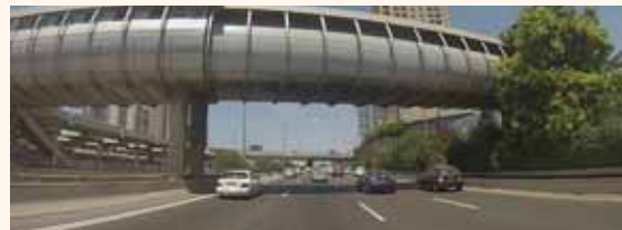
מאת: מ. יוד

עומסי תנועה נרשמו באזור מחלף ההלכה בתל אביב בעקבות רכב שעלה באש