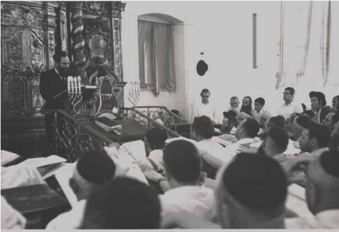
ונהיה לתלמידו המובהק.