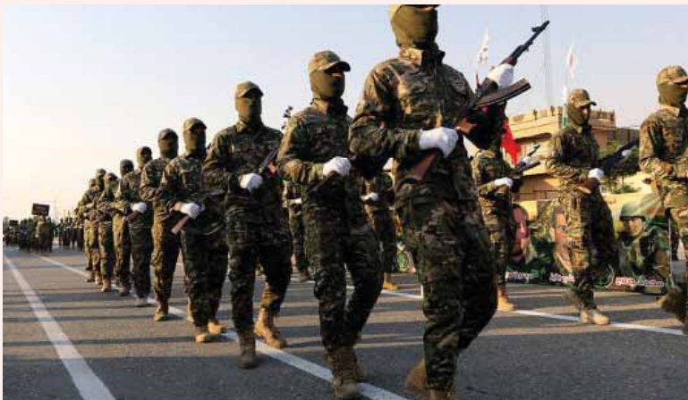
מאת אברהם ויסמן

בהרוגים כוחות באסיג', אנשי כוח קודס וחיזבאללה