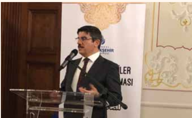
מאת אברהם ויסמן

שר החוץ של איחוד האמירויות השיב ליועצו של ארדואן והתייחס לכך שטורקיה עצמה מקיימת יחסים עם ישראל