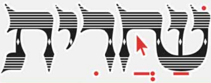
העתון הדיגיטלי היומי של הציבור החרדי