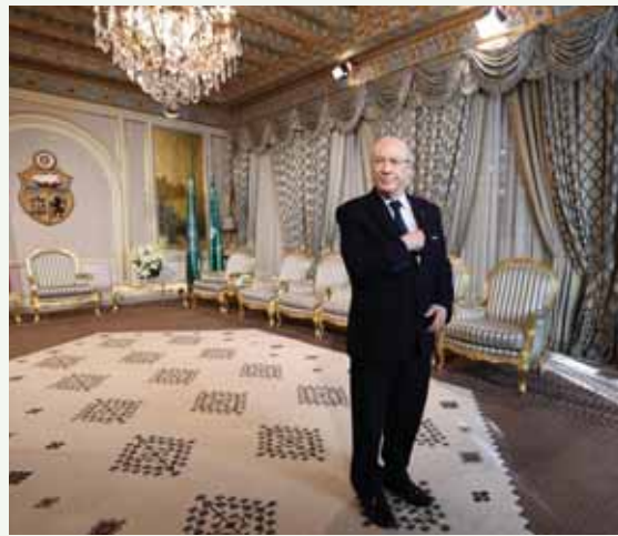
מאת אברהם יסמן

א-סבסי היה לנשיא הראשון של תוניסיה שנבחר בבחירות דמוקרטיות לאחר המהפכה האזרחית