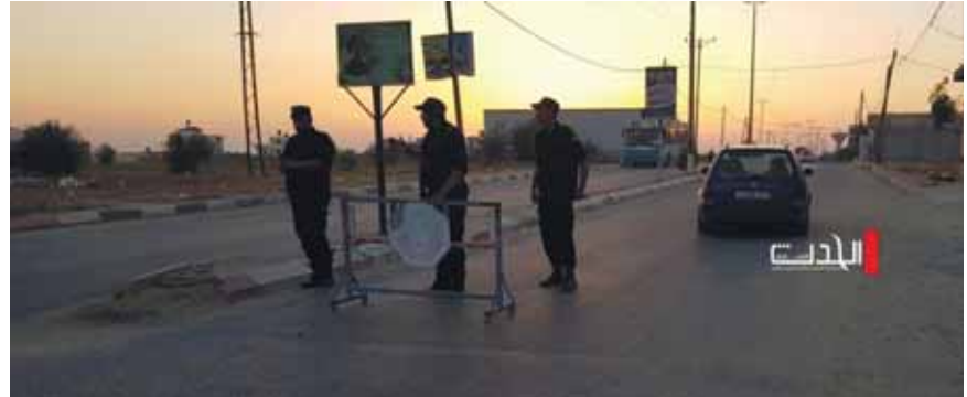
מאת סופרנו הצבאי

ארגון הטרור קיים תרגול רחב היקף לכוחותיו לקראת אפשרות של התנגשות קרקעית מול כוחות צה"ל ■ במסגרת התרגיל, הפלסטינים דיווחו כי משרד הפנים הכריז על רמת כוננות גבוהה וכל המעברים נסגרו