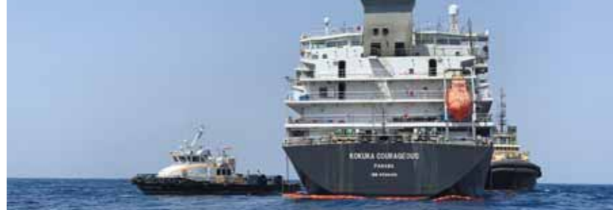
מכלית נפט מאיחוד האמירויות נעדרת מאז מוצאי השבת האחרונה. כוח דווח איתומול בבלי התקשרות האמריקאים. באיחוד האמירויות העדיפו שלא לאשר או להכחיש את הדיווח, ואילו בכיר אמריקאי אמר לכלי התקשורת כי החשד המיידי נופל על איראן, וכי ארה"ב שוקלת את צעדיה בנושא.

המכלית נסחפה לשטחי המים הטריטוריאליים של איראן ומאז נותק עמה הקשר