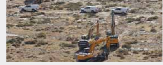
מאת דוד שמואלי

סגנית שר החוץ נחשפה להכפלת הבניה הפלסטינית הבלתי חוקית ולקביעת העובדות בשטח ■ לא ניתן יד להקמת מדינה פלסטינית דה פקטו