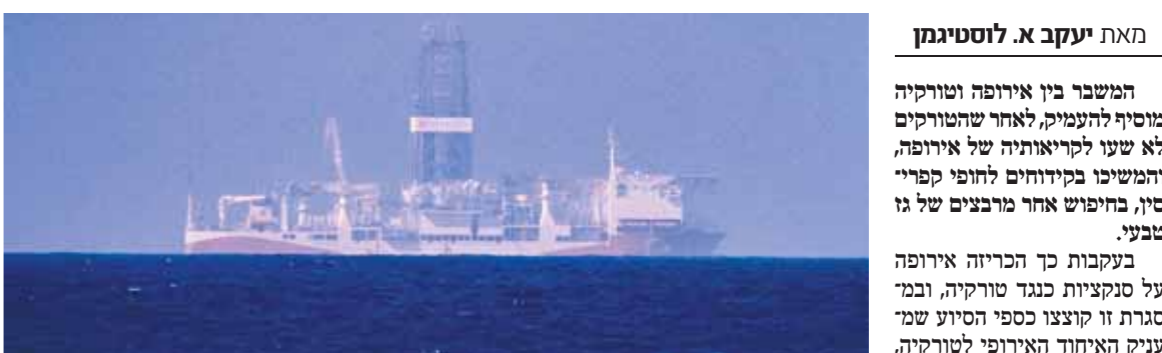
מאת יעקב א. לוסטיגמן המשבר בין אירופה וטורקיה מוסיף להעמיק, לאחר שהטורקים לא שעו לקריאותיה של אירופה, המזמינו בקידוחים לחופי קפריסין, בחיפוש אחר מרבצים של גז טבעי.

אנקרה הבהירה כי תמשיך בקידוחים שהיא מבצעת לחופי קפריסין ■ "אירופה צריכה אותנו והיא תבוא אלינו"