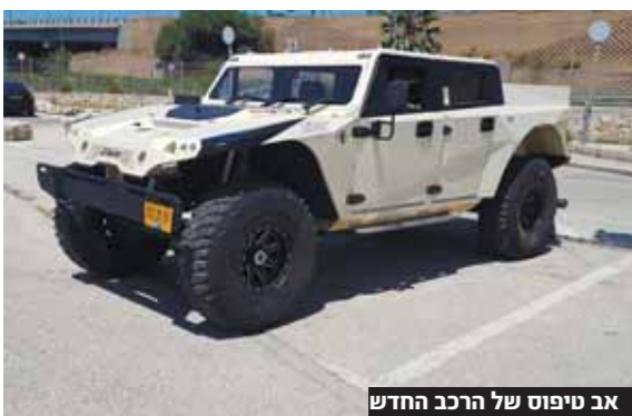
אב טיפוס של הרכב החדש