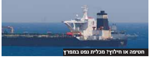
חטיפה או חילוץ? מכלית נפט במפרץ

מאת יעקב א. לוסטיגמן איראן אישרה את הדיווחים שהתפרסמו בכלי התקשורת, ולפיהם מכלית נפט נחטפה על ידי משמרות המהפכה אל חופי איראן, בעת ששטה במפרץ הפרסי. עם זאת, לאיראן יש גרסה שונה לאירוע, ולטענה מכלית הנפט נקלעה למצוקה ושגרה אותות מצוקה, מה שהביא להיגייסות איראנית באמצעות סירות של משמרות המהפכה שהגיעו לעזרת המכלית, וגי