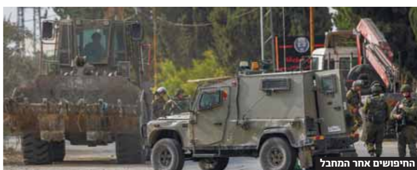
החיפוש אחר המחבל

ביהמ"ש הצבאי קבע - אה המחבל מברקן ידע על החזקת הנשק ושישב הליכי משפט ■ הוא זוכה מעבירה של אי מניעת הפגיעה