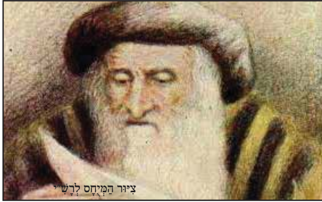
ציור המיחס לרש"י

ללא אומר ודברים פתח רש"י את מגרת השלחן, הוציא ממנה