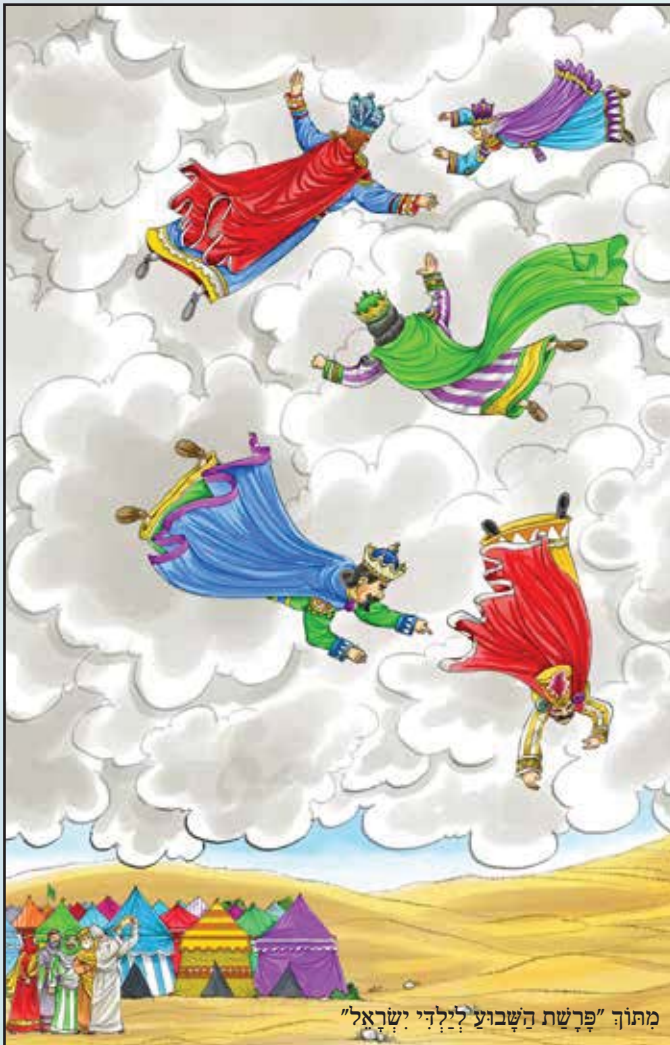
מתוך "פרשת השבוע לילדי ישראל"