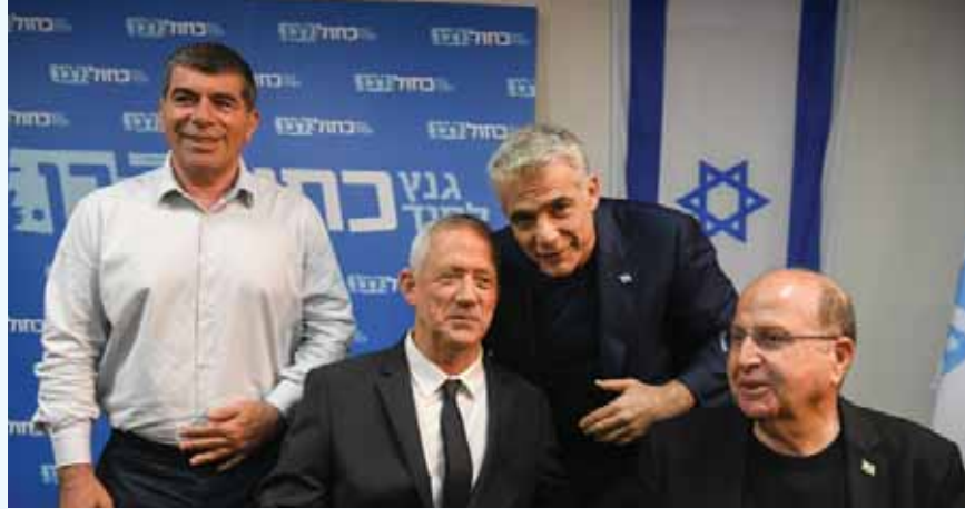
חבר כנסת אחר סיפר כי "יש את חוד החנית של הח"כים שמתראיינים לתקשורת, וזה ממרמר מאוד

תגובת כחול לבן: "חברי הכנסת של כחול לבן קיימו בחודש האחרון 218 ראיונות בתקשורת, ועוד עשרות מפגשים עם הציבור. כחול לבן גאה בנבחרת הח"כים המרשימה שלה, שעוסקה בהחלפת השל-טון ב-17 בספטמבר.