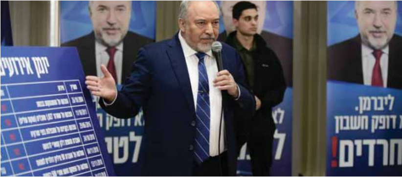
חא"ת: ת. פרנקל

הודיע כי בכל מו"מ קואליציוני ידרוש, מלבד תיק הביטחון והקליטה, גם את תיקי הפנים והבריאות