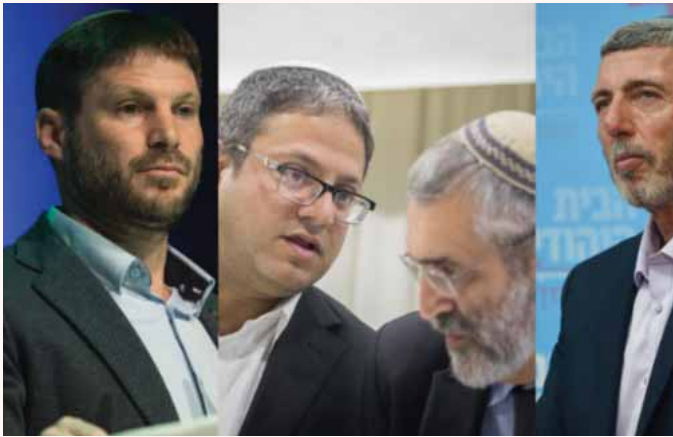
מאת: ח. פרנקל

נכון לעכשיו, בן גביר השיב בשלילה להצעה והמשיך בדרישתו לקבל את המקום החמישי ברשימה