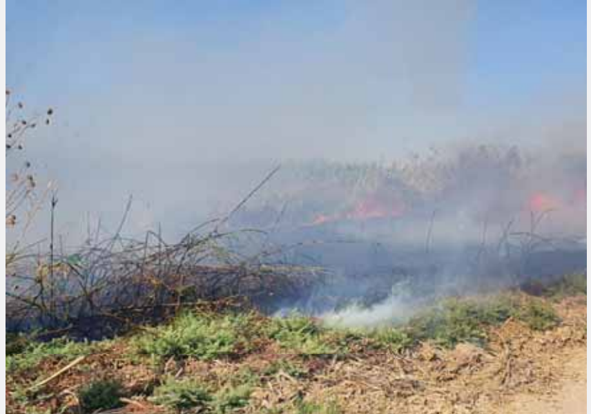
מאת: מ. יוד

שריפה שנגרמה מבלון תבערה פרצה אתמול סמוך לקיבוץ עלומים שבעוטף עזה. זו השריפה הראשונה מזה כשבר עיים, שבדלקה בשל נפילה של בלון ששוגר מרצועת עזה. השקט היחסי הגיע על רקע דיווחים על התקדמות במ געים להסדרה בין ישראל לעזה. על פי דיווח בעיתון אל-חיאת, בתום פגישות המשלחת המצ'רית עם חמאס הוסכם כי בימים הקרובים צפוי להסתיים השלב הראשון בבנייתו של בית חולים בצפון הרצועה במימון בינלאומי, ובתוך כשמונה שבועות יוכל בית החולים לקבל 500 מטופלים. מקורות פלסטיניים אמרו לעיתון כי משלחת של רופאים מעזה אף הגיע לבית החולים סורוקה בימים הקרובים כדי לבחון את הצידוד הרפואי הדרוש לבית החולים בעזה. בעניין שיפור תשתית החשמל, בפגישה הוסכם כי משלחת קטרתית הגיעה לעזה על מנת להתחיל בהנחת הקו.