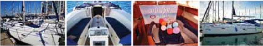
פינת שכיבה מפנקת בשמש

מתאים במיוחד לזוגות, ימי הולדת, ימי נישואים, פגישות מתקדמות