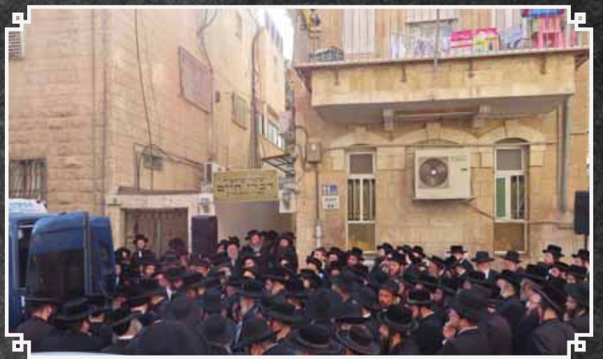
הילולת האדמו"ר מספינקא ירושלים זצ"ל