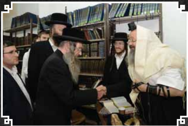
היכלת הרה"ק משטפושט זי"ע