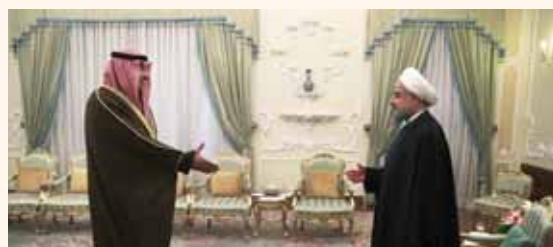
מאת אברהם יסמן

שר החוץ של איראן, מוחמד ג'אווד זריף, הבהיר כי איראן מוכנה לדיאלוג עם אחת מיריביו תיה העיקריות - סעודיה. בדיברים שנשא שר החוץ האיראני אמר: "איראן מוכנה לדיאלוג אם גם סעודיה תהיה מוכנה". לדברי ריו, "מעולם לא סגרנו את הדלת לדיאלוג עם שכנינו ולעולם לא נסגור את הדלת לדיאלוג עם שכנינו". האיראני מפתיעים לנוכח העוינות הרבה ששוררת בין שתי המדינות המייצגות כל אחת זרם אחר באיסלאם. בעוד איראן מזהה עם הזרם השיעי הקטן יחסית, סעודיה מייצגת את הזרם המרכזי באיסלאם - את האיסלם לאם הסוני. דבריו של שר החוץ