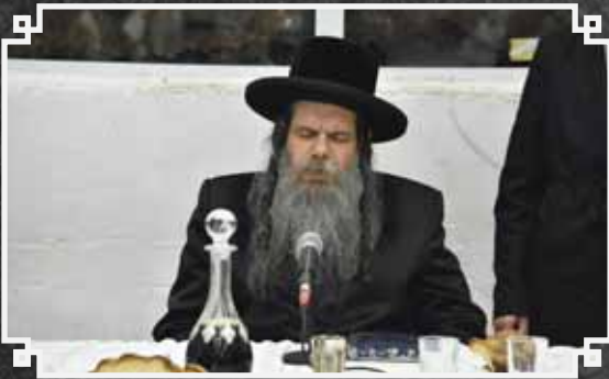
ציכום: יהודה פרקוביץ