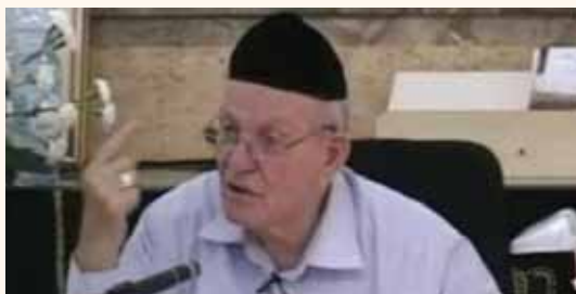
מאת: ישראל לביא

המקובל הגר"י בצרי, שבמשך שנים למד עימו בחברותא מספר על גדלותו: "הוא היה נותן 90% מהמשכורת שלו לצדקה. הוא היה מחלק את כל מה שיש לו לצדקה, הוא לא היה משאיר לעצמו על השולחן מאומה"