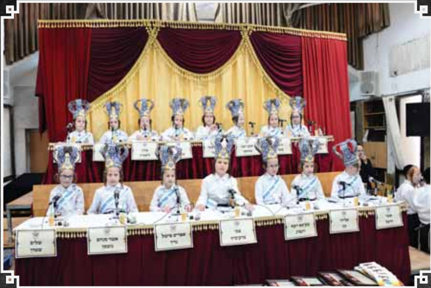
ציכום: שוקי לדר