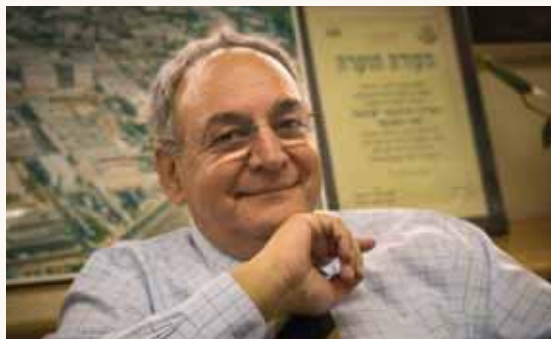
מאת: ישראל לביא

מרכז הדסה על המינני: "נביא לישראל סל תרופות חדש. היקף תקציבו יהיה לפחות 700 מיליון ש"ח ובימים הקרובים נפרסם את חברי הוועדה"