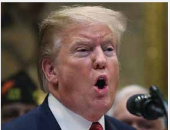
בארגונים המתנגדים לישראל, אולם יעבירו אליהם פחות כסף.

לפי שירות המודיעין של שווייץ, איראן תמשיך לתמוך