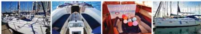
פינת שכיבה מפנקת בשמש | פינת שכיבה מפנקת בצל מלא | קישוט בלונים, חמנות למזכרת ושלט מזל טוב | הפלגות פרטיות על יאכטה מפוארת וזולה במרינה הרצליה

מתאים במיוחד לזוגות, ימי הולדת, ימי נישואים, פגישות מתקדמות