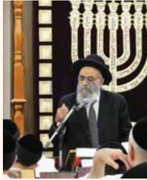
סיף: "אני לא נותן הוראות. רק מציע".

"בחופש צריך שהתלמידים דעתם תהיה על התלמידים. כל תלמוד תורה שיהיו שלוחים שילכו לבתים של התלמידים, שיבדקו מה מעשיהם ואיך הם מתמודדים עם הוריהם, וזה חשוב מאוד מדי פעם, או רבנים או שלוחים שיראו שיהיה פיקוח על הבית וככה אפי' הורים שאינם חזקים כל כך שמחזיקים טלפונים לא כשרים יתביישו וכך גם הם יתחזקו ואף ילדיהם לא יתקלקלו וירדו במעל' תן הרוחניות. אם זה יתקבל זה דבר גדול מאוד", אמר הגר"מ צדקה כשהוא מר