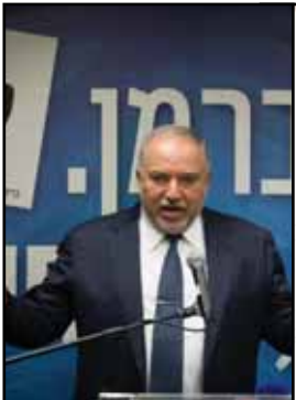
יו"ר מפלגת ישראל ביתנו, שר הביטחון לשעבר, ח"כ אביגדור ליברמן, כתב כעת בחשבון הטוויטר שלו:

במערכת הביטחון זעמו על הודעת ליברמן. "אני לא מבין מדוע אצה לו הדרך? מה הוא השיג בזה שהוא פרסם לכולם והוציא הודעה לתקשורת על תפיסת מחבלים? ממתני זה תפקידו", אמר גורם ביטחוני בכיר והדגיש כי "ליברמן צריך להיות רגיש יותר מכך"