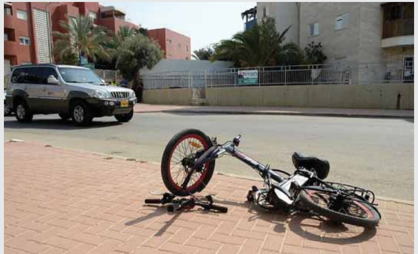
מאת: ישראל לביא

בירושלים נפגעו 239 ילדים ובני נוער בחודשי הלימודים בשנת 2018-2019, בחיפה 104 ילדים נפגעו, בתל אביב-יפו נפגעו 93 ילדים