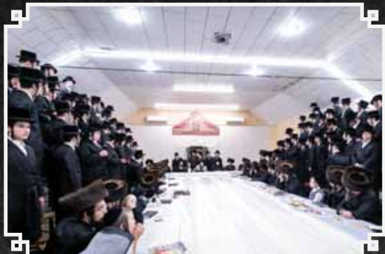
האדמו"ר מבאבוב-45 בביקור במחנה ישיבה קטנה באבוב-45 בסוואך לעייק