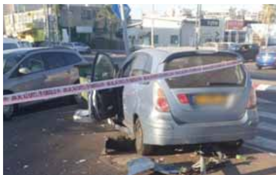
מאת: ישראל לביא

משטרת ישראל עצרה שוהה בלתי חוקי מקלקיליה שנכנס ברגל לשטחי ישראל, גנב רכב ונעצר ע"י השוטרים בתום מרדף אחריו