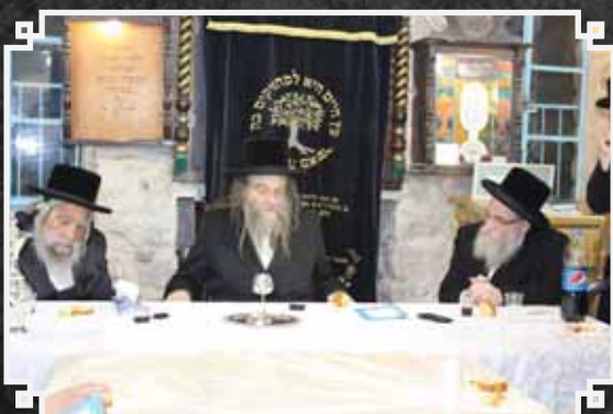
קבלת פנים לאדמו"ר מקאסוב בבית המדרש קאסוב בצפת