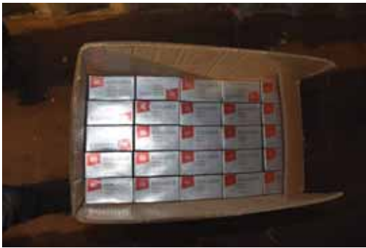
מאת: ישראל לביא

שני חשודים נעצרו במסגרת פרשיית הברחת סיגריות וטבק דרך נמל אשדוד אל הרשות הפלסטינית תוך התחמקות מתשלום מס הנאמד ב- 25 מיליון ש"ח