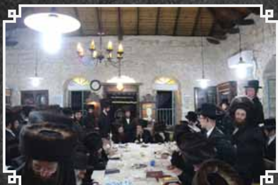
האדמו"ר מקאסוב מוצש"ק בבית המדרש קאסוב בצפת