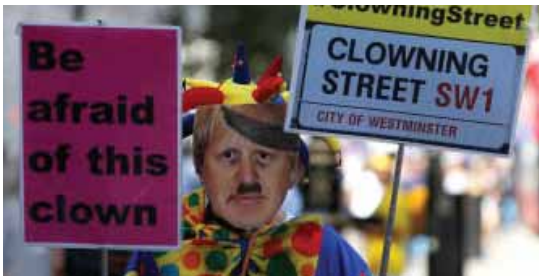
מאת אברהם יסמן

ראש ממשלת בריטניה השעה את הפרלמנט בלונדון, במטרה לאפשר את היפרדותה של בריטניה מהאיחוד