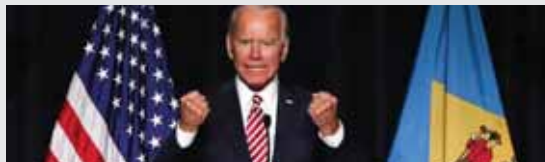
מאת אברהם יסמן

ג'ו ביידן לא דייק בנוגע לתקופה, למקום ולמעשה הגבורה שסיפר כמו לגבי עוד פרטים בסיפור