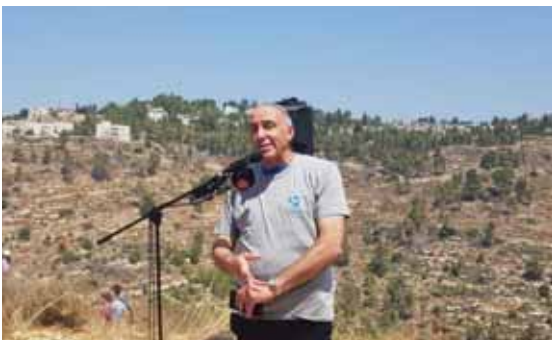
מאת: ישראל לביא

הדברים נאמרו באירוע לזכר רינה הי"ד במעייני עין-בובין הסמוך לדולב היכן שנרצחה ע"י מטען נפץ קטלני