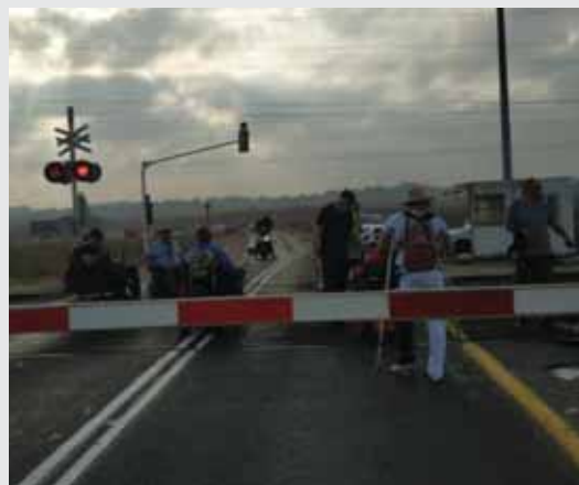
מאת: מ. יוד

מסילת הרכבת בין תחנת בית יהושע לשפיים נחסמה לתנועה על ידי חברי ארגון "הנכים הופכים לפנתרים" • בהמשך חסמו המפגינים גם את כביש החוף באזור יקום