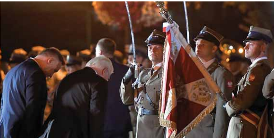
מאת פ. יחנן

בפולין מציינים את יום השנה לתחילת המלחמה בשורה של טקסים • נשיא גרמניה: "מרכזין את ראשי בפני הקורבנות הפולנים של הרודנות הגרמנית ומבקש סליחה"