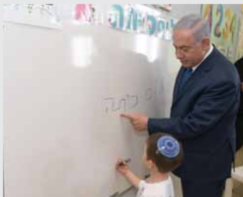
מאת: ח. פרנקל

בטקס פתיחת שנת הלימודים באלקנה אמר נתניהו: "אנחנו נבנה עוד אלקנה ועוד אלקנה ועוד אלקנה"