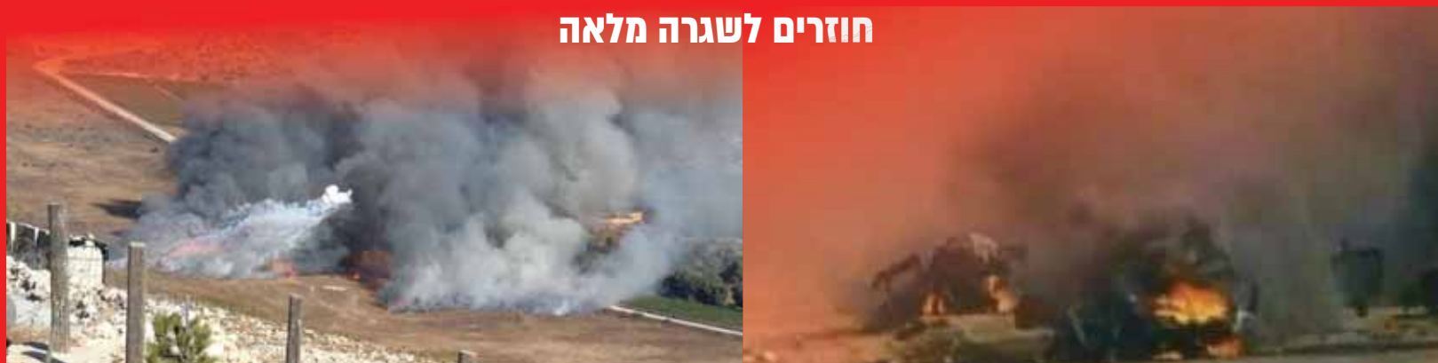
חוזרים לשגרה מלאה

החיזבוללה החליט להגיב אתמול על התקפות צה"ל וירה טילי נ"ט לעבר בסיס צה"ל ורכב צבאי • מהמקום פונה חייל במסוק לבית החולים רמב"ם בחיפה ובחיזבאללה הודיעו: המטרה נפגעה • שעות לאחר מכן התברר: לא היו נפגעים ישראלים בתקרית • בצה"ל ביימו חיילים פצועים ופינוי מוסק ע"מ שחיזבוללה יחשוב שהצליח לפגוע בחיילים ויפסיק את הירי • התרגיל הצליח בחסדי שמיים ובצפון חוזרים לשגרה מלאה