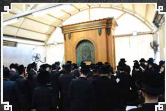
האדמו"ר מלעילוב ירושלים בתפילה במערת המכפלה