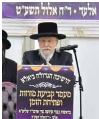
בתורתם באין מפריע.