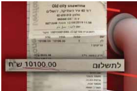
מאת: ישראל לביא

"אמרתי לו שיעביר שוב את הכרטיס, והוא אמר שהוא לא יודע איך לעשות את זה. עכשיו אני מבינה שזו הייתה כנראה תרמית", אמרה התיירת