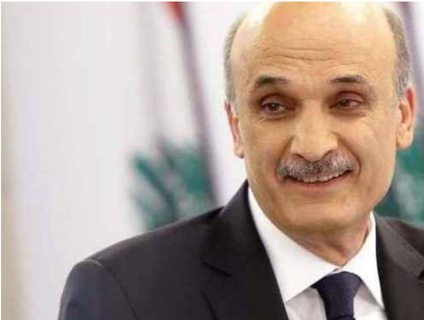
מאת: ישראל לביא

לדבריו, "לא יעלה על הדעת להעמיד את לבנון בפני האפשרות של מלחמה הרסנית", בעקבות המתחים האזוריים