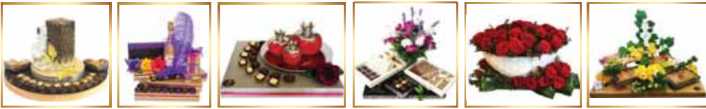
* עד גמר המלאי למוצרים שבמבצע בלבד