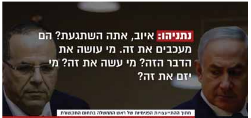
מתוך התייעצויות הפנימיות של ראש הממשלה בתחום התקשורת

ביטן הסביר את זעמו של רה"מ ואמר כי "המועצה צריכה ליישם את מדיניות הממשלה ולא להגיד לא לכל דבר"