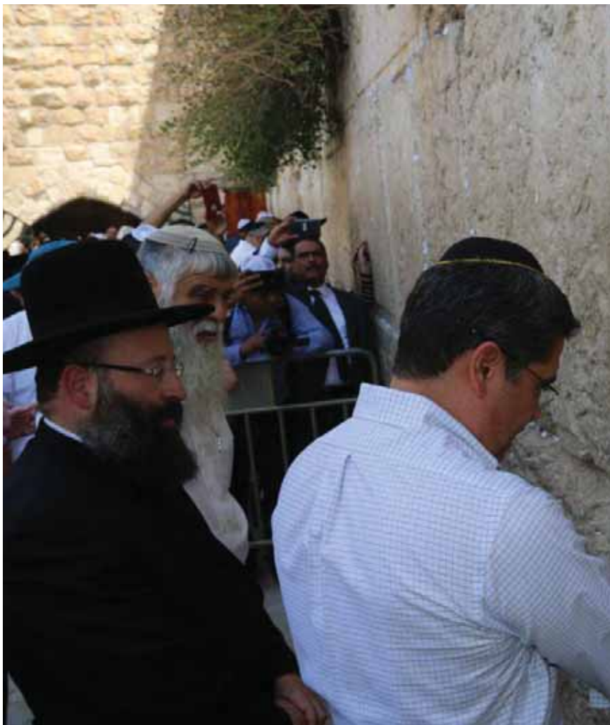
חאת: ישראל לביא

חואן הרננדס אלברדו, נשיא הונדורס, הגיע יחד עם רעייתו לביקור בכותל המערבי במסגרת ביקורו בירושלים, בה אמור לפתוח משרד מסחרי - דיפלומטי.