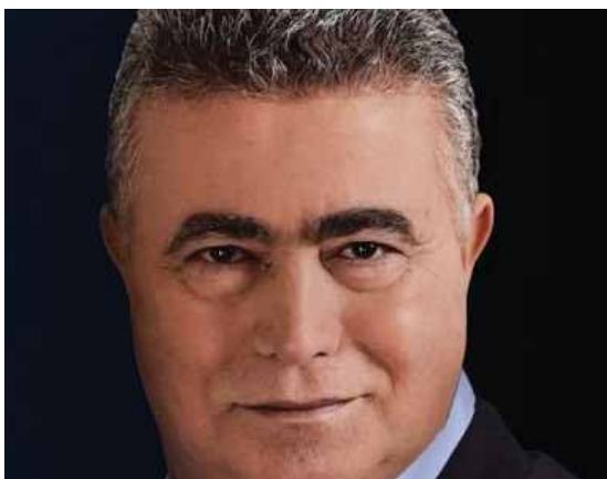
מאת: ח. פרנקל

נשיאת מועצת הכבלים: "נדהמתי ונבהלתי. זה לא בסמכותו של נתניהו"