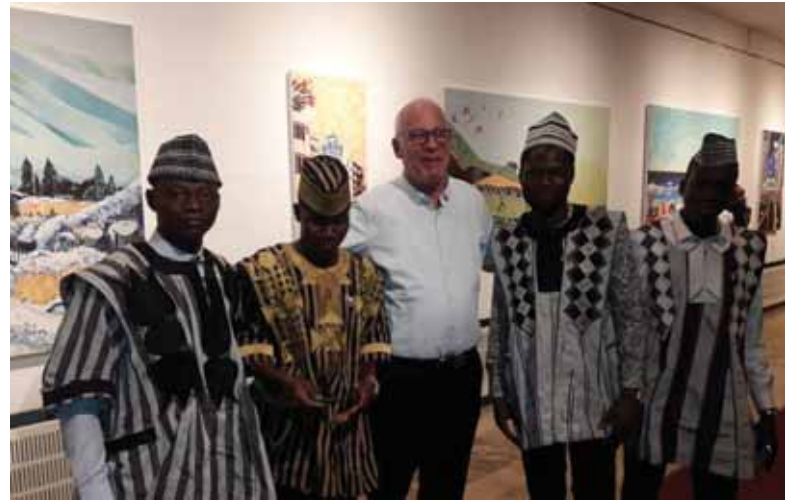
חאת: ישראל לביא

שר החקלאות אורי אריאל: "המשתלמים יהוו שגרירים של רצון טוב עבור מדינת ישראל, ויביאו לחיזוק הקשרים בין ישראל למדינותיהם גם בתחומים נוספים"