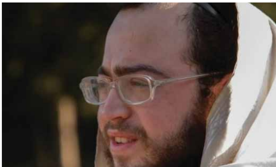
מאת: מ. יוד

לפני ארבעה חודשים נהרג ר' פנחס מנחם פשוזמן הי"ד מרסיסי רקטה שנורתה מעזה לעבר אשדוד בסבב ההסלמה האחרון בדרום • אתמול נולד לו בן