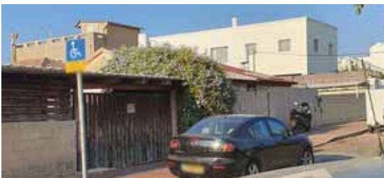
מאת: מ. יוד

צוות הגן הפרטי אמר לאם הילדה, שהגיעה לאסוף אותה בצהריים, כי בתה כלל לא הגיעה היום • האם התעקשה - והילדה נמצאה ברכבה של בעלת הצהרון אחרי ששהתה שם כשעתיים