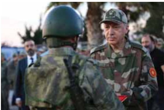
עוד כי בכוננתו להקים אזור בטוח במזרח סוריה כבר בת-קופה הקרובה, עד סוף החודש.

ארדואן מעוניין להקים אזור בטוח במזרח סוריה