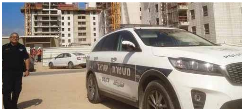
מאת: מ. יוד

מסגר שביצע שיפוצים במרפסת בקומה הרביעית בבניין, נפל ונפגע קשות • צוות מד"א ניסה לבצע בו החייאה, אולם נאלץ לקבוע את מותו