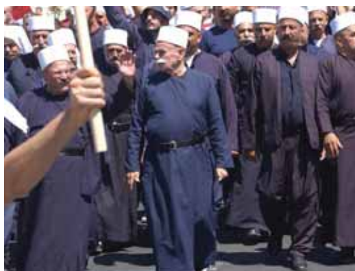
מאת: מ. יוד

משלחת של שייח'ים דרוזים התכוונה להגיע לסוריה למרות שהוזהרו כי מדובר בפגיעה בביטחון המדינה • לטענת השייח'ים, היו בדרכם לאתר נבי הביל