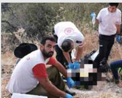
לא יכול יותר ללכת.

"אבא שלי ממוטט, הוא באפיסת כוחות", אמר הילד. "תן לי בבקשה מישהו מבוגר שנמצא לידך", ביקשה החובשת שנענתה מיד על ידי הילד הצעיר: "אין לידי מישהו מבוגר. זה רק שנינו, אנחנו עכשיו באמצע ההר"