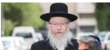
בא לשכונה, אנחנו עם נתניהו. נתניהו קיים את מה שהוא הבטיח לנו, לכן אין לנו סיבה להחליף אותו."

ליצמן הבהיר כי "בכל מערכת הבחירות לא תקפנו את גנץ, הוא זה ששינה את כללי המשחק"