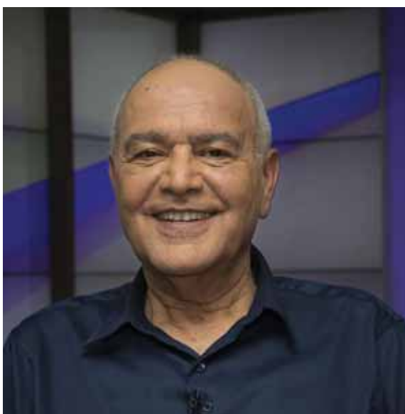
מאת: מ. יוד

רמטכ"ל מלחמת לבנון ה-2 התייחס לחילופי האש בגבול: "הפעילות הישראלית מעכבת מאוד את האיראנים. זה הישג". על פגישה בין טראמפ לרוחאני: "בגלל המדיניות שלנו"