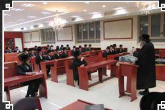
מעמד חנוכת הבית והכנסת ספר תורה לבניין החדש של ישיבת ערלוי בבני ברק