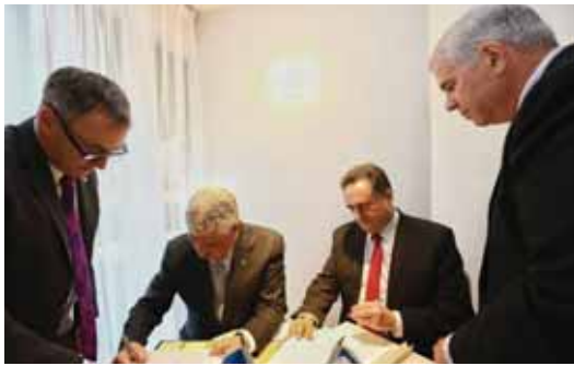
מאת: מ. יוד

"החמאס והג'יהאד מקרבים את קיצם כשהם הופכים לכלי שרת איראני" אמר אתמול שר החוץ • דובר חמאס על תקיפות צה"ל הלילה ברצועה: "התוקפנות הישראלית בעזה היא פעולתו של הכיבוש במאבקו נגד עמנו"