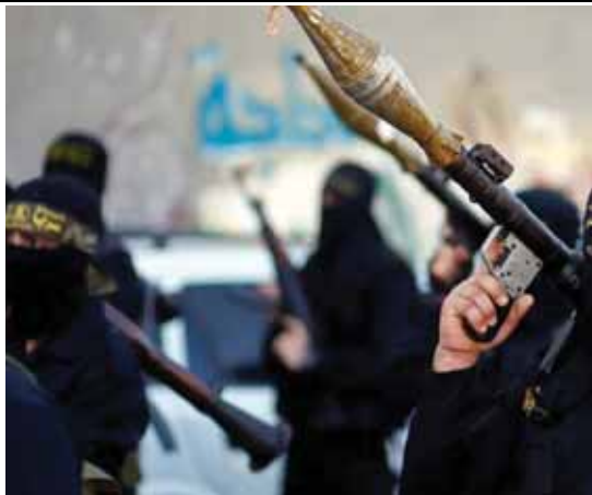
מאת: מ. יוד

תשעה ימים לפתיחת הקלפיות, חדירת הרחפן ושיגור הרקטות מהווים סימן נוסף לנפיצות ברצועה ♦ בצה"ל פועלים להרגיע את השטח, אך המצב עלול להוביל לפיצוץ