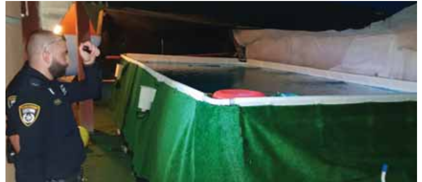
מאת: מ. יוד

הילדה בת ה-9 טבעה בכריכה בעיר בית שמש לפני כשבוע וחצי ומצבה הוגדר קשה ♦ לאחר שהחלימה שוחררה אתמול מבית החולים