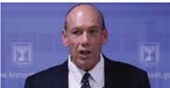
הדו"ח ייבא עד אחרי הבחירות. גורמים באוצר אמרו בתגובה: "שינוי מתכונת הבדיקה מריח כמו ניסיון לעיכוב פרסום הדו"ח החמור".

בעקבות החלטתו של אנגלמן להרחיב את הבדיקה, נדחה מועד פרסום הדו"ח לאחרי הבחירות