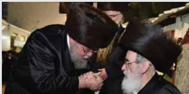
המדרש ויז'ניץ ברחוב עזרא בבני ברק לעבר בית החיים.

מזקני וחסידי ויז'ניץ • נפטר לאחר מחלה קשה