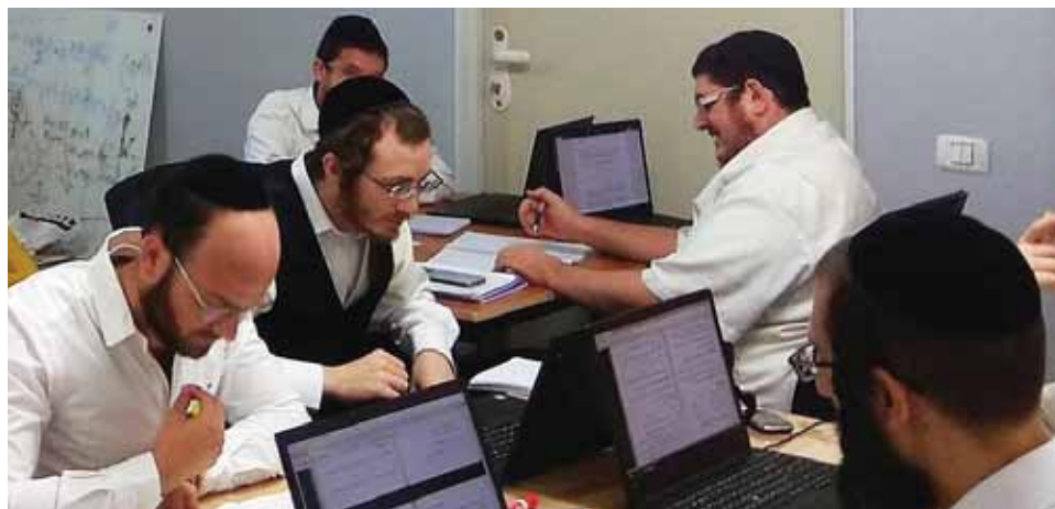
מאת: ישראל לביא

דו"ח שהוציא רשות החדשנות חושף: כ-40% מחברות ההייטק הישראליות לא שכרו בשנה האחרונה מהנדסים זוטרים כלל, מה שמונע מצעירים חרדים שלא שירתו בצבא להשתלב בתעשיית ההייטק