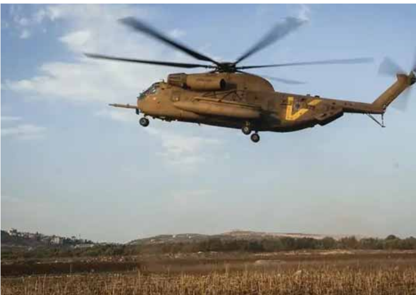
מאת: מ. יוד

התרגיל מתקיים עד יום רביעי בהשתתפות משרתי סדיר ומילואים ♦ במסגרתו יתורגלו תרחישי התקפה והגנה על פי התוכניות המבצעיות של צה"ל