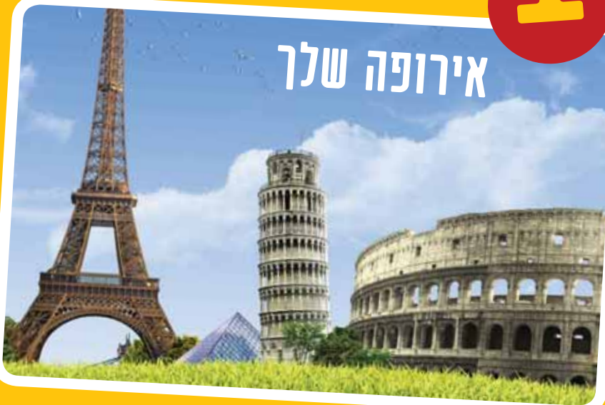
וגם יטוס לאירופה?