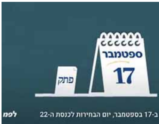
ב-17 בספטמבר, יום הבחירות לכנסת ה-22

שהועברה למזכירי הקלפי היא כי נציגים מטעם סיעות המתמודדות יחדיו, ברשימת מועמדים אחת לכנסת, אינם רשאים להיות נוכחים במקום הקלפי בעת ובעונה אחת - בין אם אחד הנציגים הוא חבר ועדת קלפי והשני משקיף, ובין אם שניהם משקיפים.