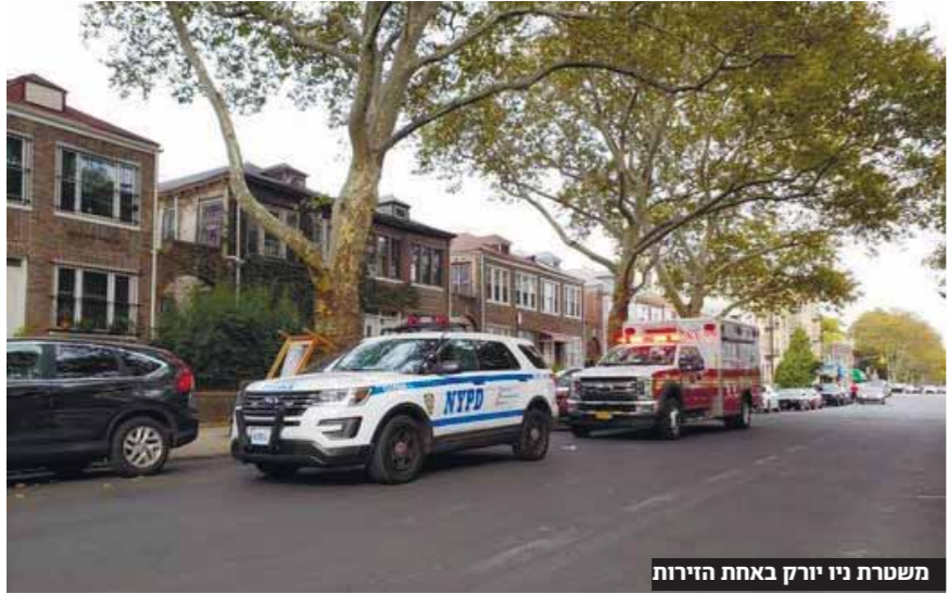
משטרת ניו יורק באחת הדיווח

במהלך השנה האחרונה חלה עליה של יותר מ-63 אחוזים בתקיפות אנטישמיות כלפי יהודים