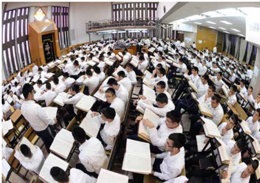
עולם התורה הספרדי משגשג. בני ישיבה רכונים על תלמודם

מחירו הממוצע בשוק הוא בין 107 ל-118 שקל. דגם GA-100 נמכר בקניינות ב-549 שקל. מחירו בשוק 'האזרחי' בין 350 ל-450 שקל. דגם GA-400 נמכר לאסירים ב-599 שקל. מחירו ברחוב - 400 שקל! צודקים האסירים - הם נעשקים!