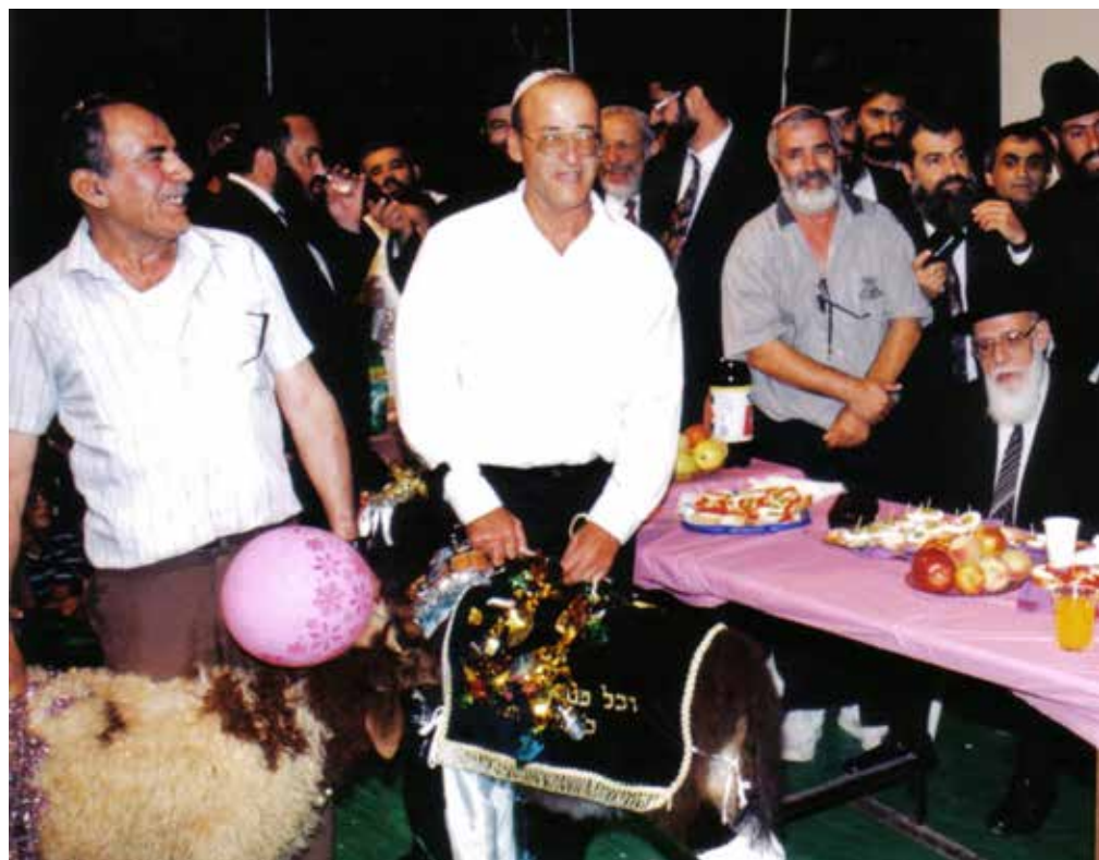
להיזכר ולהתרפק. התייעוד הנדיר מהטקס