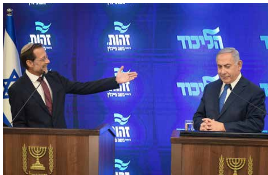
היריבים המרים הפכו לשותפים. מסיבת העיתונאים של נתניהו ופייגלין

לצד המתקפות, נתניהו פועל בשלושה אפיקים נוספים: האחד - למנוע שריפת קולות