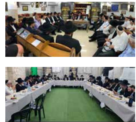
מתגייסים בכל הכוח. מימין לשמאל, למעלה: הכינוסים בביתר עילית, רמת גן ובית שמש. למטה: הכינוסים בהרצליה, פתח תקווה, בני ברק ומודיעין עילית