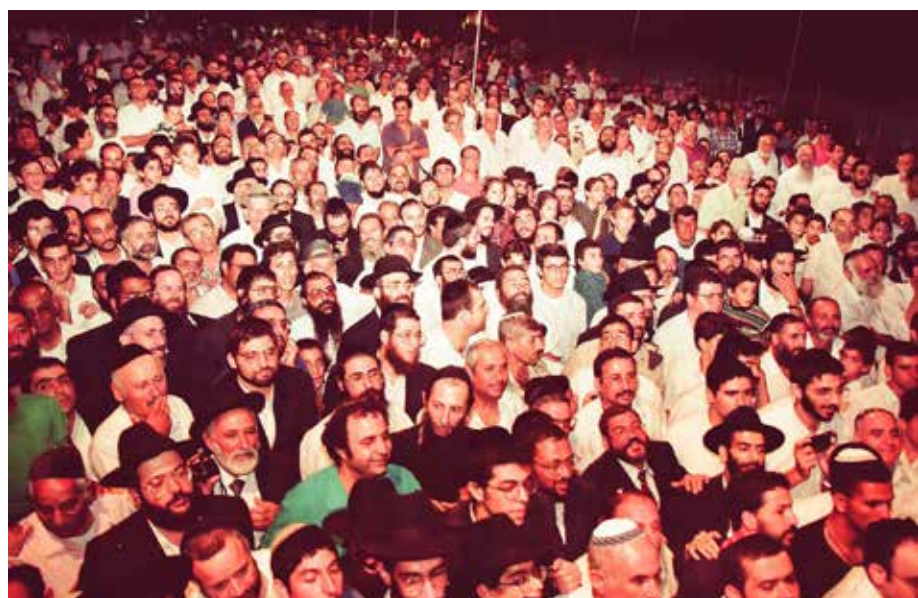
מי שהיה במעמד ההוא, לא ישכח אותו לעולם. קהל האלפים