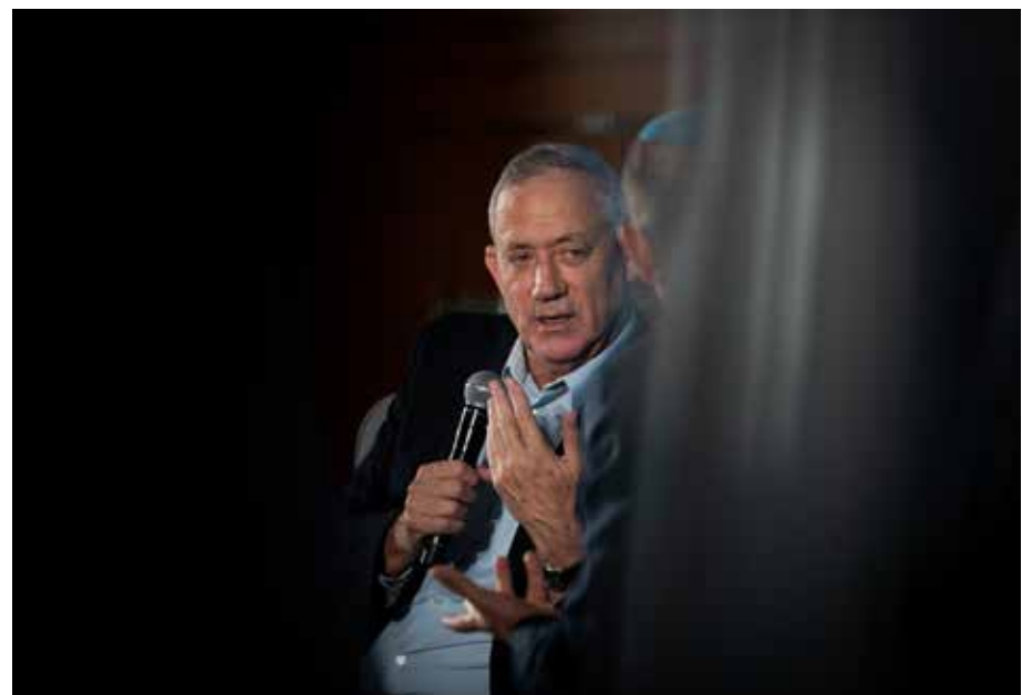
מלחמה גלויה על ה' ועל משיחו. בני גנץ

קריטריון אחר שכוון נגד הציבור החרדי הוא סעיף המעניק את הזכאות להטבה רק למי שהתגייס לצבא או לשירות לאומי. כך למשל בתוכנית מע"מ אפס שיזם לפיד ונועדה להקל את משבר הדיוור, ולאפשר לזוגות צעירים לרכוש דירה ראשונה ללא מע"מ, הוכנס אותו סעיף מפלה שהדיר עשרות אלפי משפחות חרדיות, שהן הסובלות ביותר ממצוקת דיוור חריפה וקשה. כל זאת לצד שורה ארוכה של קיצוצים קשים בעשרות תקציבים הנוגעים לציבור החרדי ולחיי הדת במדינה, כמו תקציבי התמיכות, תקציבי המקואות ובתי הכנסת ועוד ועוד.