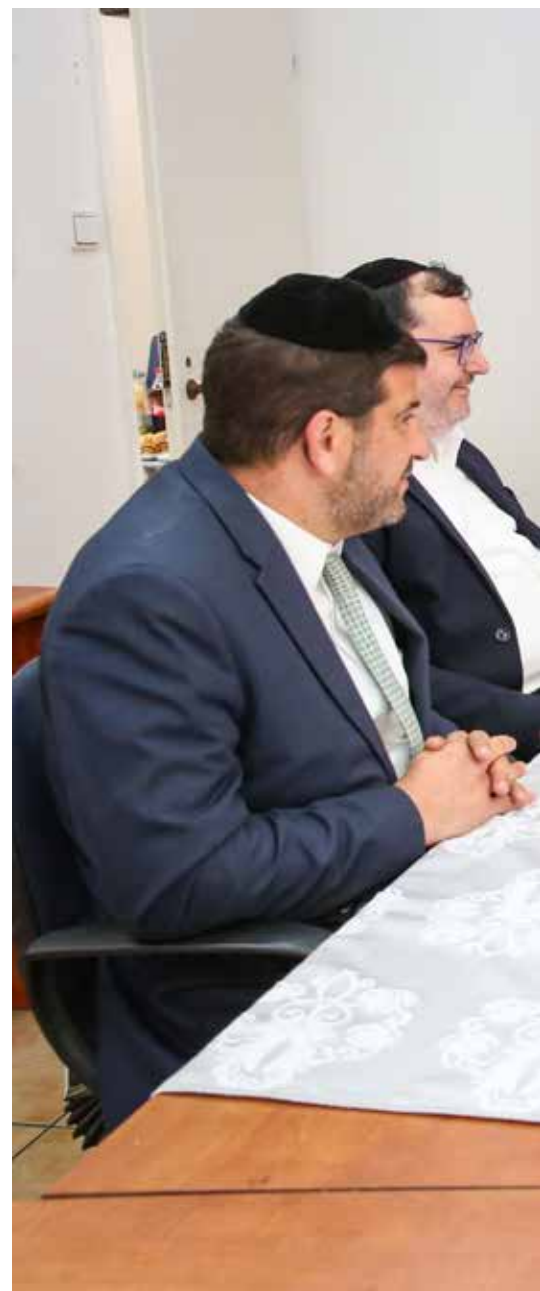
אמיר ושותף לבי

כל משאית כזו מביאה ביום בין 10 ל-20 טון מזון, שמסייעים לאלפי משפחות. לכן כשאדם בא ותורם זה מכפיל כוח, יש לזה כוח מיוחד של הציבור. אני מתחבר לדברים של הרב יעקובי, אכן רואים את הערכות ההדדית שרק מתחזקת בזמני מצוקה, וזה מה שנותן לנו את הכוח."