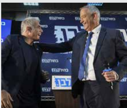
אחים לדרך. גנץ ולפיד

אוי לרשע ואוי לשכנו: בכירי כחול-לבן גנץ, אשכנזי ויעלון מצטרפים לשותפים לפיד במסע ההסתה המבחיל נגד הציבור החרדי ומציגים את החרדים כסחטנים וקיצוניים שמתעניינים רק בכספים • מצהירים שיפעלו להקמת ממשלת הזדון: נקים ממשלה חילונית אנטי דתית ללא חרדים • הסכנה מוחשית: גוש הימין נחלש ל-54 מנדטים, וגוש השמאל בראשות לפיד וגנץ קרובים להקמת ממשלת שואה אנטי חרדית • יו"ר תנועת ש"ס השר הרב דרעי: "גנץ, אתה תישא באחריות אישית לקרע ולשסע בעם" • כי תעביר ממשלת זדון מן הארץ