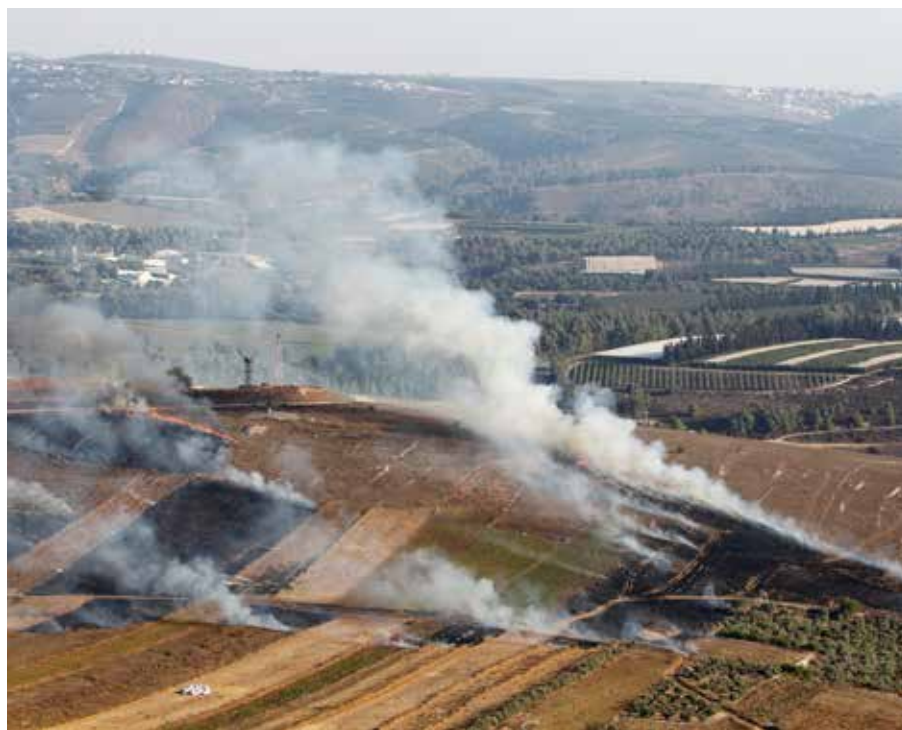
צה"ל ידע למה לצפות. ההפגזה בלבנון לאחר ירי הנ"ט