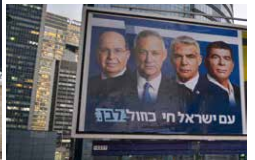
לקראת שעת האפס. תעמולה לקראת הבחירות לכנסת ה-22

לבחירות וכן בפרסומים בעיתונות הכללית והדתית. יו"ר הבית היהודי פרץ התנגד להצבתה של שקד ללא שאר השותפים ברשימה המאוחדת. לעומתו, סמוטריץ' הסתייג בטענה כי באזורים מסוימים שבהם יש ריבוי מצביעי הציונות הדתית או בפרסומים בעיתונות הפונים לקהל הדתי, שקד צריכה להופיע יחד עם ראשי הבית היהודי והאיחוד הלאומי.