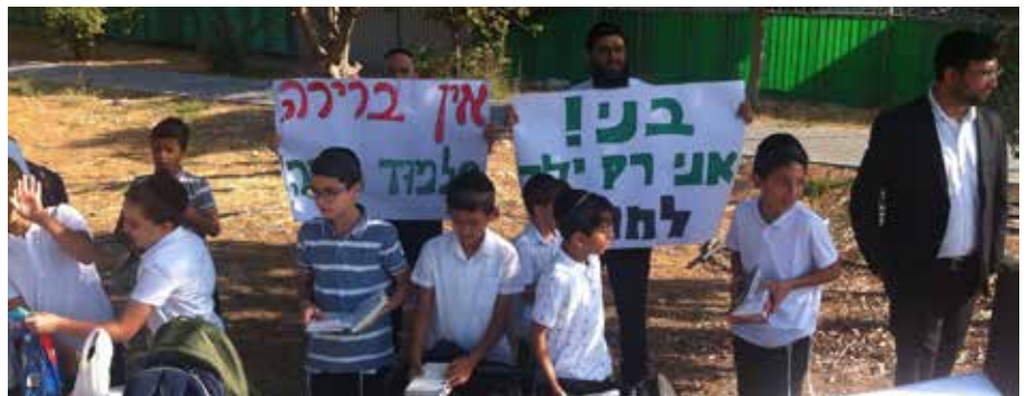
"גדלנו פה, ממשיכים פה". ההפגנה במעלה אדומים

ובמעלה אדומים, דורש משרד החינוך מראש העירייה לפנות מבני חינוך לטובת התלמוד תורה