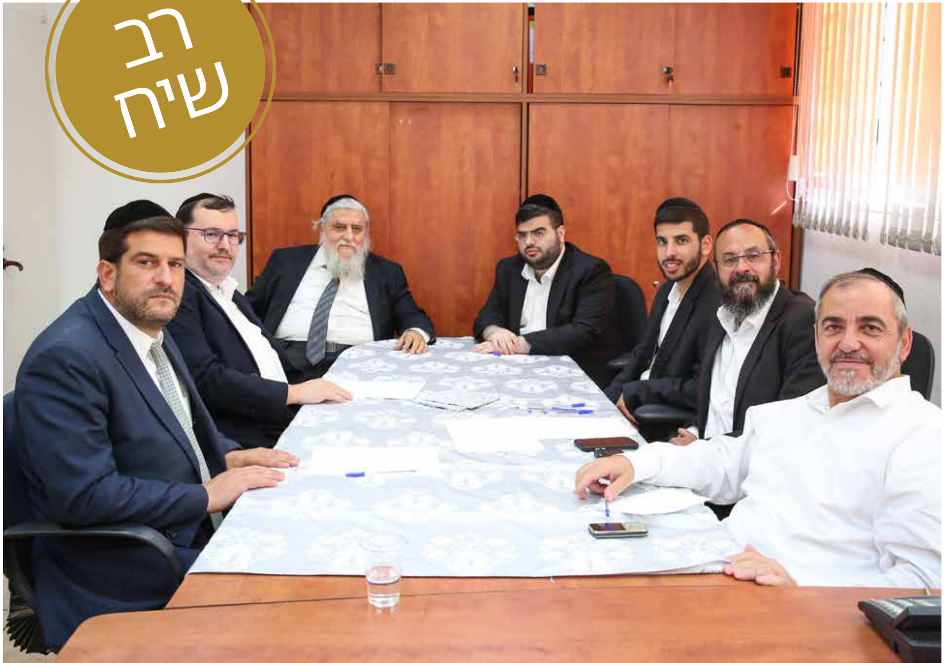
"חבר חדה מונפת". ראשי ארגוני החסד סביב שולחן 'הדרך'

שנשארו ומעביר אותם לבית של אחותי, שם מכינים מהם סנדוויצ'ים ובבוקר אברכים ואימהות עוברים ולוקחים כריך לילדים לבית ספר. בשלושת השבועות, כשהאולמות לא פעילים, ראית שזה חסר לאנשים, אנשים התקשרו כל פעם ושאלו, אולי היה איזה אירוע ונשאר משהו.