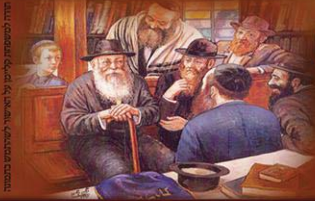
תודה למשפחת קליימן על האישור לפרסום התמונה