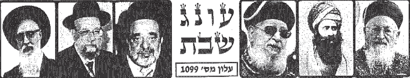
עלון מס' 1099

מוקדש לע"נ הרה"ג הרב יהודה צדקה זיע"א, הרב הגאון בן ציון אבא שאול זיע"א והרב הגאון עובדיה יוסף בן גורגיה זיע"א