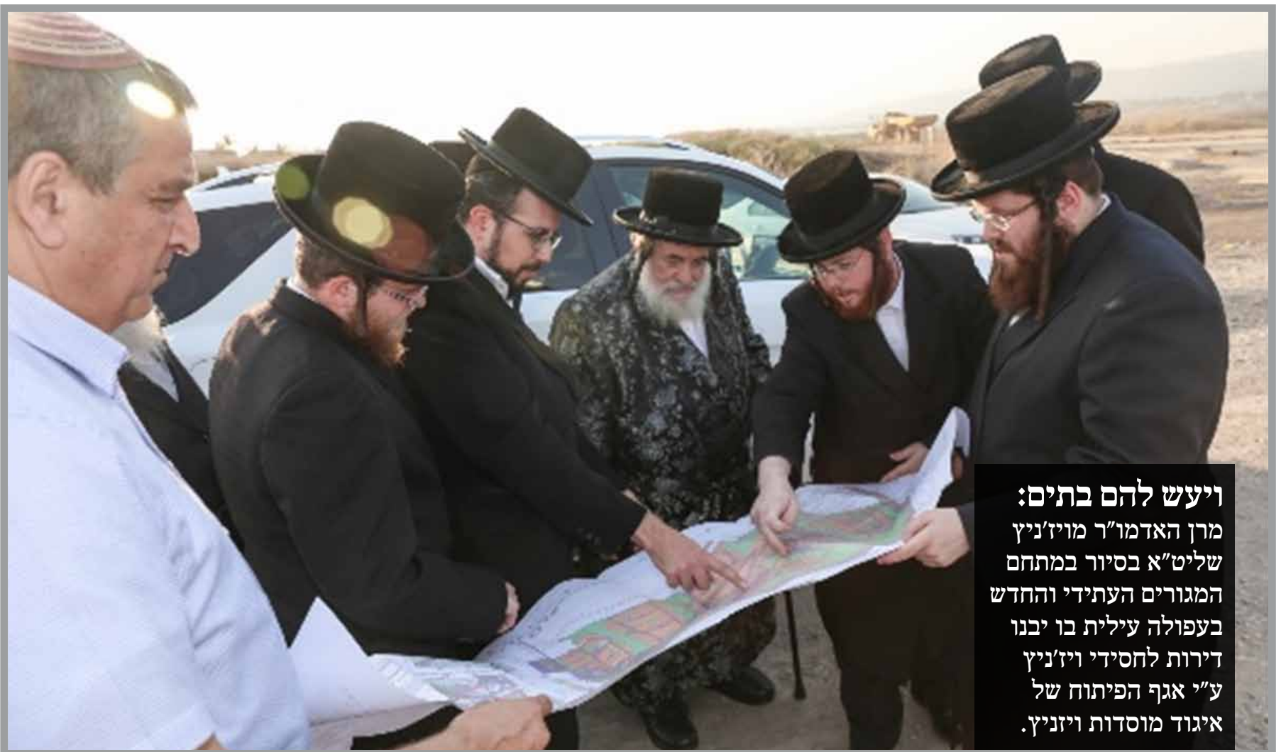
ויעש להם בתים: מרב האדמו"ר מויז'ניץ שליט"א בסיוור במתחם המגורים העתידי והחדש בעפולה עילית בו יבנו דירות לחסידי ויז'ניץ ע"י אגף הפיתוח של איגוד מוסדות ויז'ניץ.

כ"ק האדמו"ר מתולדות אהרן שליט"א ביקר ביקור ראשון והיסטורי בקהילה החדשה בעיר חריש. כמו כן קבע מזוזות למקוה החדש וכן לשני הכיתות החדשות בת"ת "חסד נעוריך" דחסידי תולדות אהרן שהתווספו לאחרונה לרגל התרחבות הקהילה לאחמ"כ איחל האדמו"ר שליט"א