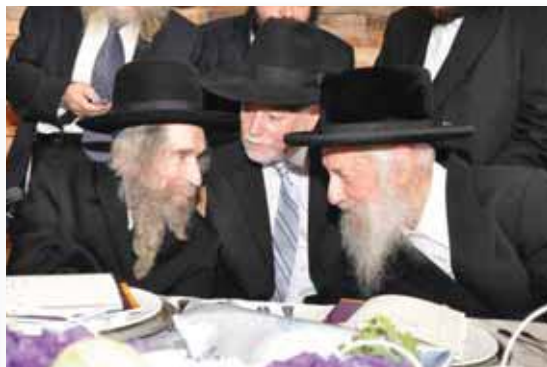
בכנס למנהלי התתיים

האם אי פעם הרגשתם תשוּקה עצומה שהבקר כבר יעלה, השמש תזרח, הצפורים יציצו, ואתם תזכו לעמוד ולהוציא מפיהם מלה אחת, עצמית, שתסדך בנשמתיכם בחות רוחניים, אמונה, בטחון, אהבה עמוקה לבורא, התרפקות והשענות מחלטת על אבא שבשמים, מלה שתציף את עיניכם בדמעות של התרגשות יהודית ושתמעינו אתכם בכח לכל היום?!