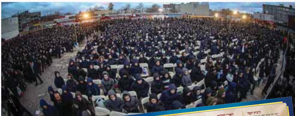
בכנס לילדי בני אמונים בני יודק

חקמינו ז"ל למדו אותנו דבר נוסף בנוגע לכמות האמנים שצריך לענות מדי יום, שהיא תשעים אמנים, כמנזן 'צדיק', מנזן זה נוגע לאמנים שיש לענות על ברכות, מלבד האמנים שיש לענות על קדישים. כדי לצבור פמות כזו של אמנים על ברכות יש דרך פמעט יחידה: