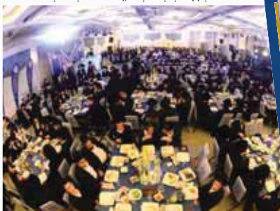
בכנס אלפי רבני בני הישיבות