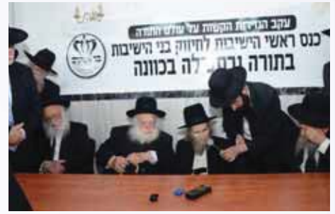
ההכנסות מיחדת של ראשי הישיבות לחזק ענית אמן

לענות 'אמן' אחר ברכות השחר של כמה יהודים. הדבר נכון במיוחד לאור המובא בספרי המקבילים שיש לענות אמינים אלו עוד לפני תפלת שמונה עשרה.