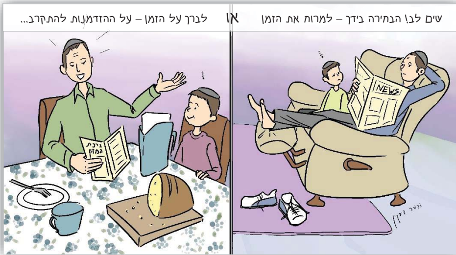
לברך על הזמן - על ההזדמנות להתקרב...

מסביר הרב שלא היה זה עונש, אלא מכיוון שתפקידו של היהודי הוא להיות כלי קיבול להתגלות האור האלוקי פה בעולם! וחושך זה מלשון לחוש, להרגיש את הזמן שבורח לך בין האצבעות, ויהודים אלו שלא