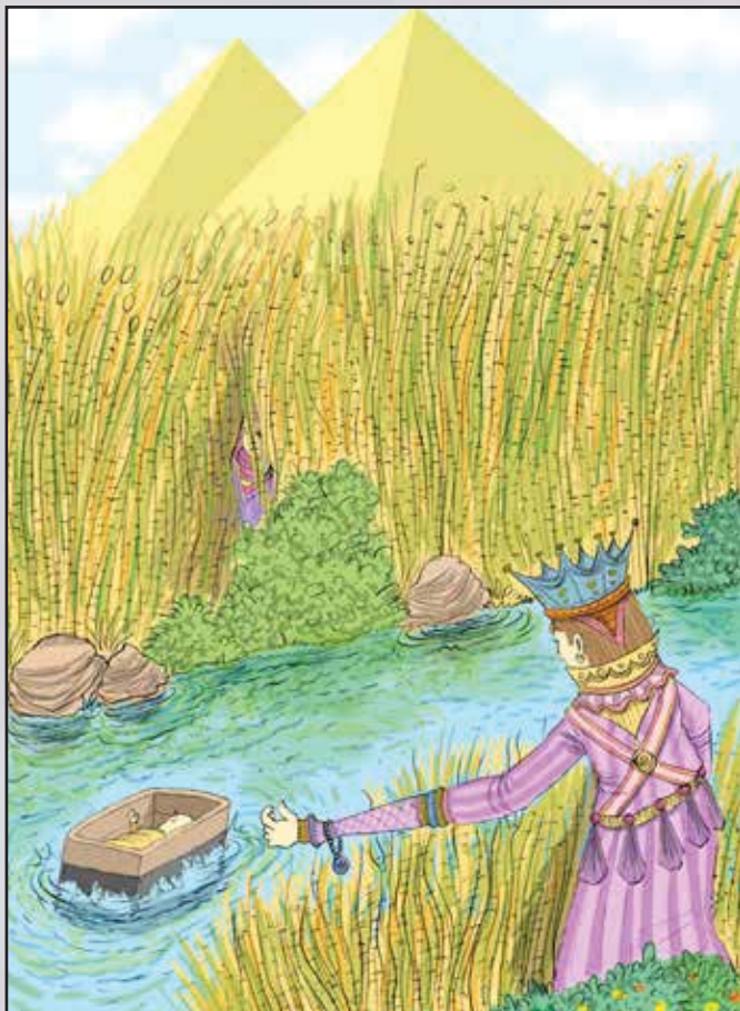
סוֹחַר: "הַפְּרָשָׁה חִסְפָּרַת לִי" שְׁמוֹת