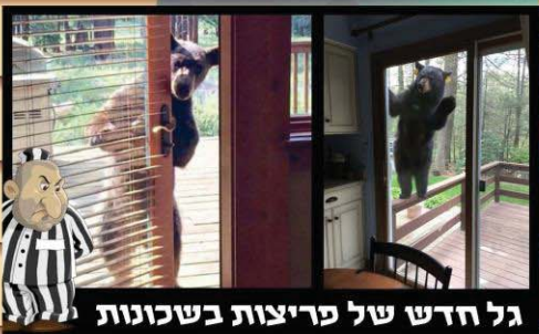
גל חדש של פריצות בשכונות