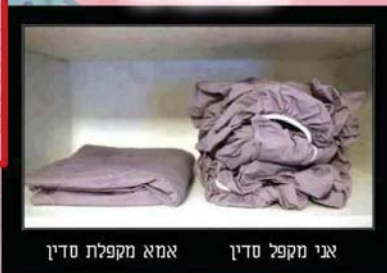
אני מקפל סדין אמא מקפלת סדין