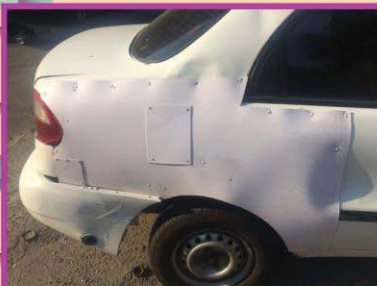
אמרו לי פחחות הכי זול בכפר קאסם - זה מה שיצא