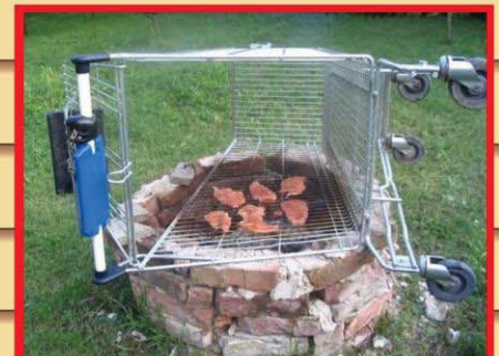
מבצע מנגל בעלות 5 ש"ח פיקדון