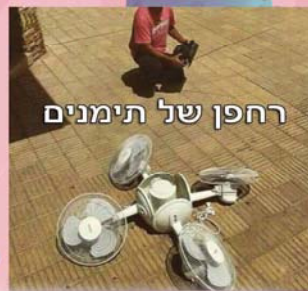
רחפן של תימנים

זה פעם ראשונה שאני לא טס השנה לתאיילנד בגלל הקורונה כל השנים לא נסעתי כי לא היה לי כסף 🤔🤔