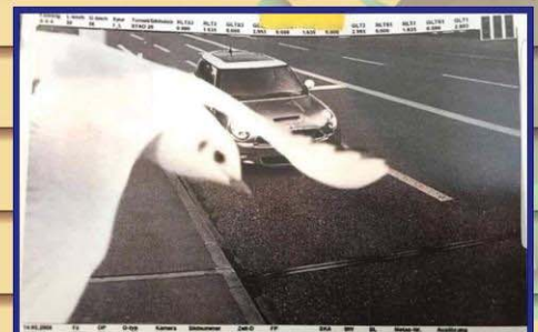
השגחה פרטית - יונה עברה מול מצלמת מהירות