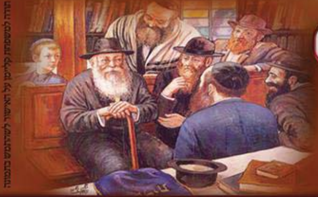
תורה לטעמתה קייטן על האישור לשריתוש בתמונה