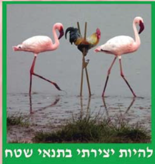
להיות יצירתי בתנאי שטח