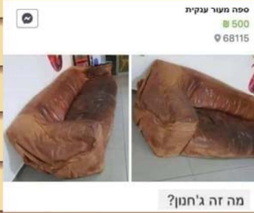
מה זה ג'חנון?

שח רבי יהושע מאוסטרובה זצ"ל יש האוהבים את האמת יען שהדבר מועיל להם יש האוהבים את השקר יען כי הדבר מועיל להם נמצא שאין הם לא אנשי אמת ולא אנשי שקר אלא אנשים האוהבים את עצמם איש אמת אוהב את האמת על שאמת היא בין אם מועילה לו ובין אם לאו.