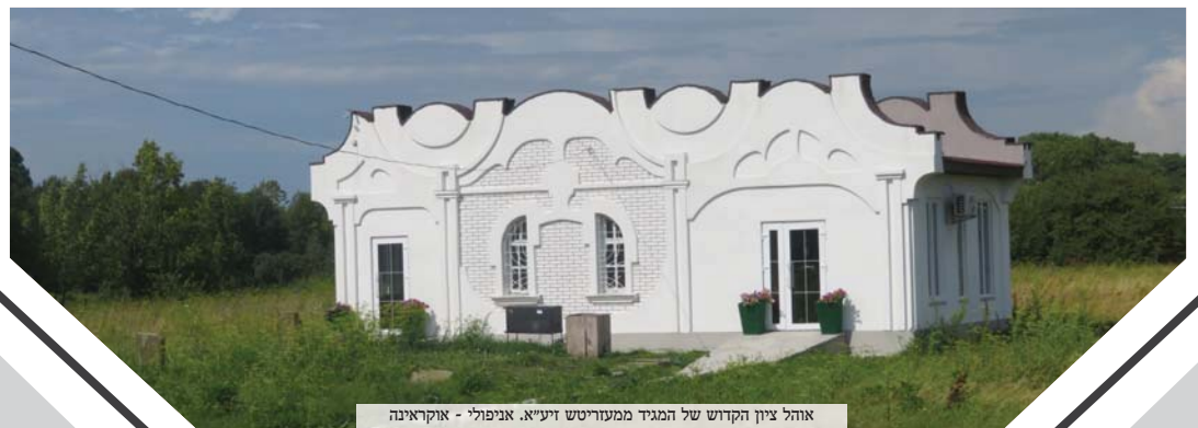
אהל ציון הקדוש של המגיד ממעזריטש זי"ע. אניפולי - אוקראינה

(גירסאות אלו נלקטו בקונטרס "דברי הימים" - חסידות סטאלין קארלין לדורותיה. "על ידי מכון סטאלינער קארלינר אוצר")