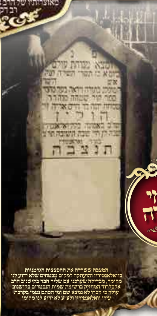
המצבה ששרדה את ההפצצות הגרמניות בוואלאנטירין והועתקה למקום מבטחים שלא ידוע לנו מקומה, מבדיקה שערכנו עם שליח חבר בקישוב הרב אקסלרוד המחזיק ברשימת שמות הנפטרים בקישוב עולה כי קברו לא נמצא שם ומן הסתם נטמן בקרבת עירו וואלאנטירין ולע"ע לא ידוע לנו מקומו