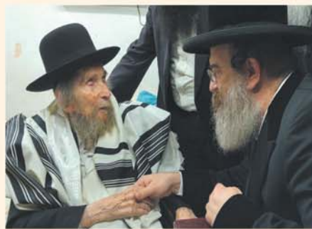
כ"ק האדמו"ר מסאדיגורה רבי ישראל משה פרידמן זצ"ל עם נשיא מועצת גדולי התורה הגאון הרב אהרן יהודה לייב שטיינמן זצ"ל. חסידות סאדיגורה היא ענף המסתעף מחסידות רוז'ין

ומאביהם. נרגש כולו יצא דרך השער החורק של חצר הביקתה אל השביל, הביט אל השמים המעוננים והתחיל לפסוע בדרך הכבושה בין שדות התבואה הקצורים. חיוך דל הסתמן על שפתיו. זאת הפעם, החליט, חייב הוא לבצע את מחשבתו, ויהי מה, אם לא עכשיו אימתי?