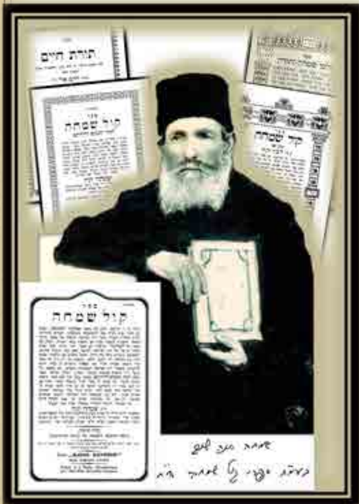
תמונת רבי שמחה יונה האלף זצ"ל, חתמוני ופולק משפטי ספריו שנדפסו בזמנותיהם בתקופות שונות בעת כהונתו ברבנות ואלאנטירין

"קול שמחה" חלק א' - אבוקה לשחיטה; דרך סלולה וקצרה בכל דיני שחיטה לנסות את עצמו בדרך שאלה ותשובה בשעה קלה אם משנתו בפיו שגורה. "קול שמחה" חלק ב' - נר לבדיקה; יאיר נתיב לחזור בו על כל דיני טריפות הריאה בדרך שואל ומשיב, וכן דינים משארי דיני טריפות השכיחים, וגם עיקרי דיני טריפות עצמות.