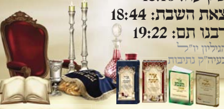
האלון נוסף לפני שאלות: מורה בת נשיאה - אלתר, איסמיה בת נשיאה - אמת כהן וכן אלו נשיאת מקראל בן אלו ארספתר