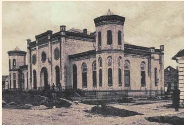
בית הכנסת בעיירה צורטקוב שהייתה ענף מענפי רוז'ין