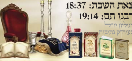
האלון נחשב לאילן נשואים: מורה בת נשואים - אביתר וסמחה בת נשואים - אביתר כהן וכן אלו נשואים מקבלים את אלו הנשואים

בית המדרש הגבוה לרבנות א"ת לשיבת אבות תל אביב