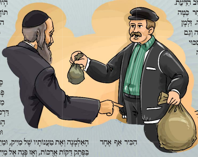
הפיר אף אחד

מייק לא האמין למשמע אונני. הוא דרש מולמן החולה שיכתב לו את זה על נר, כדי שאף אחד לא יוכל לערער על כך.