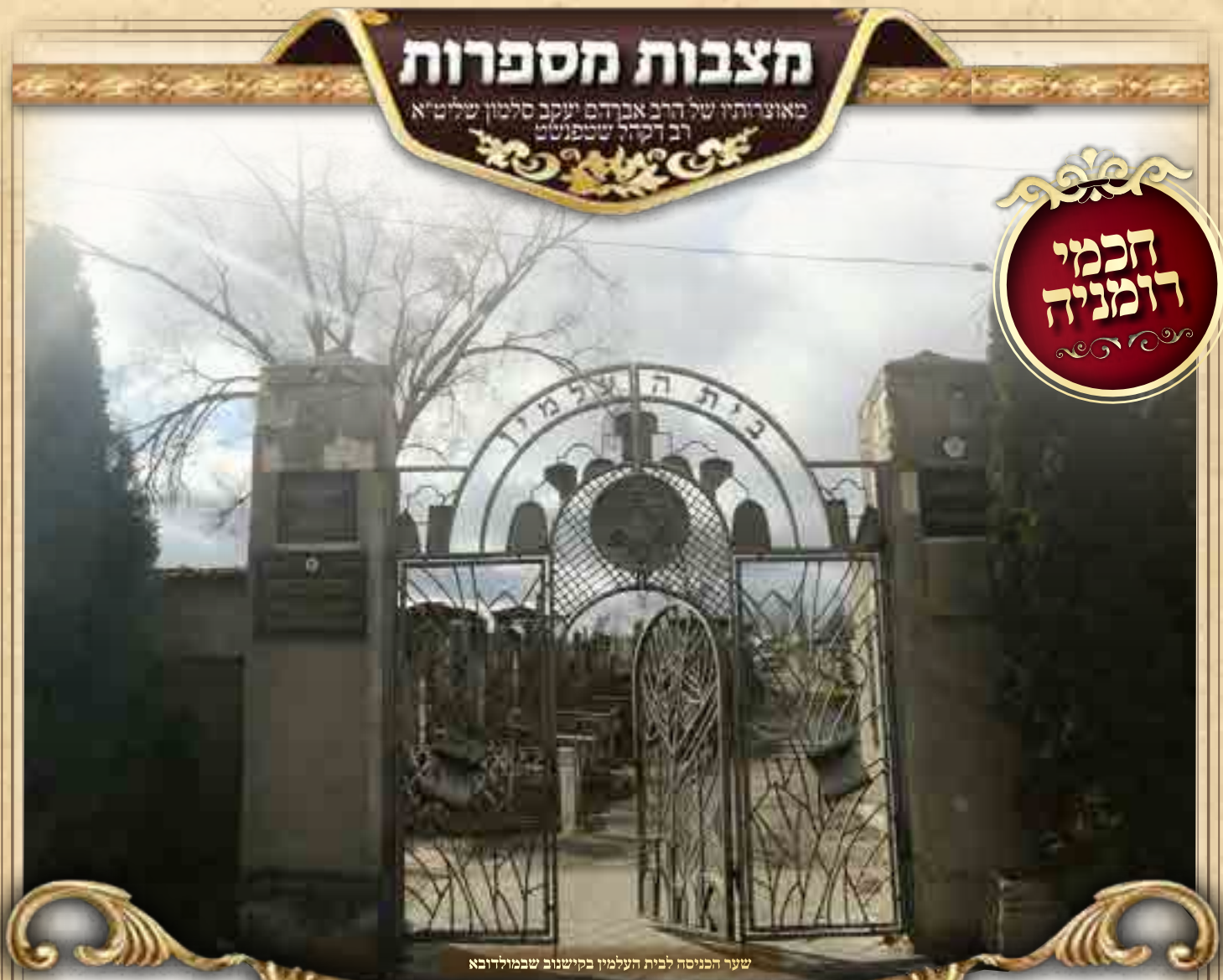
שער הכניסה לבית העלמין בקישנוב שבמולדובה