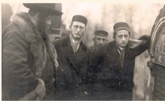
ראש ישיבת "חכמי לובלין" הגה"ח רבי מאיר שפירא זצוק"ל משמאל

אותו בשביל לימוד התורה. כל יהודי זוכה לכבוד לפי כמות התורה שלמד פה בעולם הזה. בעולם הבא אין מכריזים "ברוך הבא ר' יעקב", או "ברוך הבא ר' חיים" אלא "ברוך הבא לומד מסכת ברכות", או "ברוך הבא לומד מסכת שבת" וכו'. שם בגנזי מרומים קבועים כסאות כבוד בשביל לומדי התורה, ועל כל כסא או ספסל חרות שמה של מסכת זו או אחרת, כמו ברכות, שבת, עירובין וכו', ובעולם הבא יושב כל אחד על כסאה של המסכת שלמד.