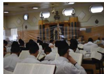
בני הישיבות לומדים במתווה הקפסולות

אז אולי הגיע הזמן שייסבירו לעולם התורה מדוע בני הישיבות דווקא הם צריכים להרגיש את זה על בשרם, ובטוחני שמספר הבחורים שאולי קבלו את זה בקלות אינו עולה על מאות מכל רבבות עמלי התורה. וכנראה שגם כך חושבים קוראני היקרים והנאמנים של 'אור השבת'. שייסבירו למה