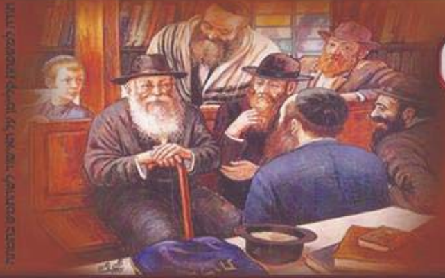
תורה למשפחה קייטן על האישור לפרויקט ברוך