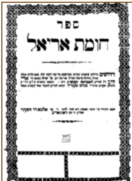
עמוד השער של ספרו 'חומת אריאל'