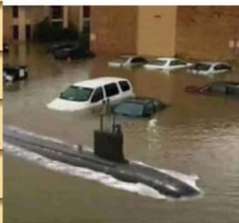
ואחרי זה יגידו שביבי סתם קנה