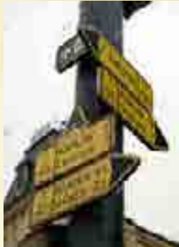
שלט על העיר קארלין, העיר בה התגדל רבנו בילדותו

מתוך ספר התולדות לרבינו הנמצא בהכנה על ידי מכונינו. ומכאן קריאת קודש לכל שוחרי תורת רבינו סייעו בעידו לעשות את עבודת הקודש בשלימות ועזרו לנו בליקוט תורתיו הנהוגות אגרותיו ותולדותיו בקודש של רבינו הגדול מפראהבישט ז"ע ועכ"א.