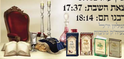
האלון נוסף לפני שאלות: מורה בת נשיאה - לבית אבי וסמחה בת נשיאה - לבית אבי בן אלון נשיאת מקבאל בן אלו לנשיאת

העלון מופץ ברבבות עותקים בארץ ובעולם מוקדש לע"נ מורד אבי רבי משה אלפסי בן עישה ז"ל