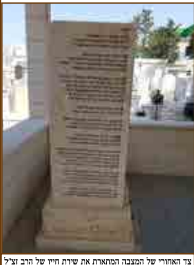
צד האחורי של המצבה המתארת את שירת חייו של הרב זצ"ל

עלינו לארץ ישראל בשנת תשכ"ד, יצאנו מגאלאץ לבוקרשט, שם היה שדה התעופה, משמה נסענו לוויאנא, דרך יגוסלבאיא, אבי התפלל בראש השנה ויום הכיפורים בבית הכנסת בוויאנא, שם היה חזן, ומשם עלינו לארץ ישראל, בין יו"כ לסוכות, אלו זכרונות שלא יסולאו בפז שנשארים עמנו לאורך ימים.