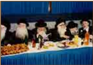
במרכז התמונה הרב זצ"ל מעיין בקובץ 'אבני שמואל' שיד"ל על ידי מכונניו לצד אדמו"רים רבנים ונכבדים

בשנת תשל"א הוציא לאור את הספר "הגיון לב" של הגאון הגדול רבי יהודה לב צירלסון זצ"ל הי"ד. את הספר עיטרו שמונה-עשרה הסכמות מגאונים, אדמו"רים וצדיקים,