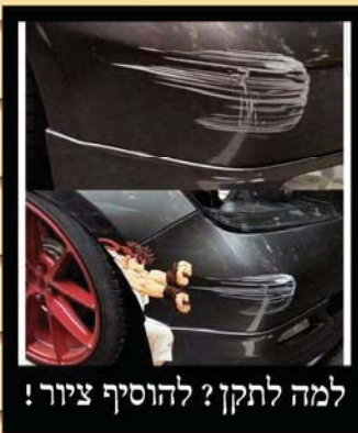
למה לתקן? להוסיף ציור!

ובתא, למה יש לך אוזניים כאלה גדולות? - זה בגלל הגומיות של המסכה.