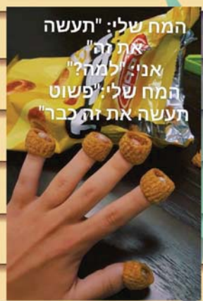
המח שלי: "תעשה את זה" אני: "למה?" המח שלי: "פשוט תעשה את זה כבר"

במלחמת העולם השנייה חיל הים של ארה"ב ניצח קרב נגד חיל הים היפני ע"י זריקה של תפוחי אדמה, היפנים חשבו שתפוחי האדמה הם רימוני יד