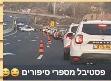
פסטיבל מספרי סיפורים 🤪🤪

מוכרת: זה יצא 1,400 ש"ח, לחלק? אני: כן חצי אני חצי את