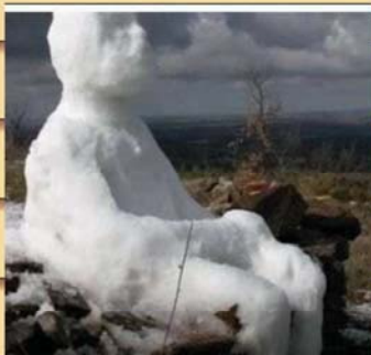
כשאתה מעל שישים והרופא אומר לשים קרח איפה שכואב

בהודו התלונן על כאבים בלסת, לאחר בדיקה בבית חולים התברר כי יש לו 526 שיניים בפה