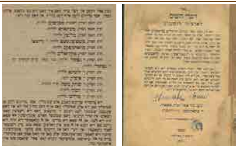
שער הספר 'דברי הימים לארצות רומניע' עם הכיתוב המתאר את י"ב האהלים שהיו בבית העלמין שנחרב בטאטאראש

בסוף ימיו השתקע כאמור בעיה"ק ירושלים, ונפטר לבית עולמו כבן חמישים ושש שנה ביום ו' תשרי שנת