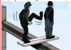
מכות בחורי הישיבה אנחנו עומדים מוקדש: לכל לומדי התורה

יש להתחיל לקרב כל יודי, גם מי שהוא 'מרום' מן המצוות, ולתת לו 'משול' לתקנו בנות. כבאלה המעידה לא ישיא שום יודי בגולה , ולכן תוכנית להטמול שכל יודי תורה לפחות מצוה אותך, כדי שלא יהיה 'מרום', בזה התורה אפולת לכל ישראל.