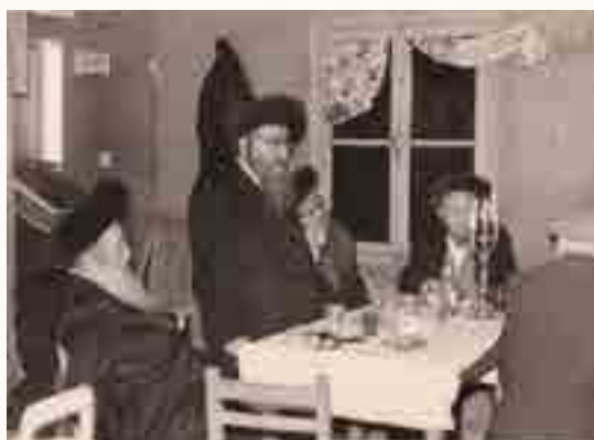
נאם במסיבת מלווה מלכא בישוב יסודות

שונים וקרא בהם ללא ברכה. אמנם היהודים שהיו בסביבתו חששו מתגובת המפקד לשמירתו המוקפדת של רבינו על המצוות, אך הוא עשה זאת ללא חת נתקיים בו הכתוב "וראו כל עמי הארץ כי שם ה' נקרא עליך, ויראו ממך". הקצין המפקד לא רק שלא גער בו, אלא אף שוחח עימו בידידות פעמים רבות וגילה התעניינות לפשר התפילין שבראשו. מסירות-נפש מיוחדת במינה גילה רבינו בהגיע חג הסוכות, כשמתוך רצונו העז לקיים מצוות סוכה אילתר לו מריצה, עליה חיבר ארבע כלונסאות ועליהם שם סכך. בתוך סוכת ארעו זו ישן ואכל במשך כל חג הסוכות בקור הנורא ששרר בחוץ. המפקד שראהו יושב על המריצה המקורה בסכך,