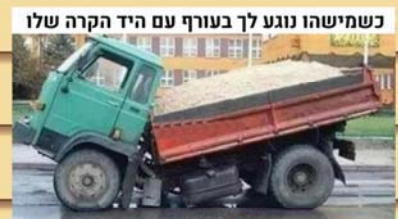
כשמישהו נוגע לך בעורף עם היד הקרה שלו

יש!! גלידה!! קרמלית פילה אה.. קציצות של סבתא