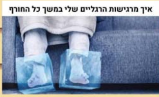
איך מרגישות הרגליים שלי במשך כל החורף

בעקבות החלטת הממשלה לאפשר לבעלי דרכונים ירוקים ללכת לאירועים אלפי תימנים מסרבים לעשות את החיסון השני