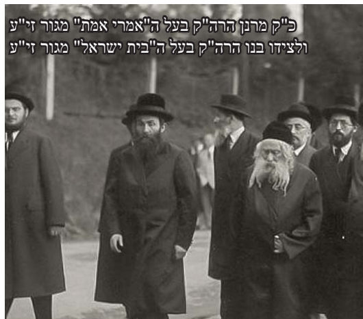
כ"ק מרן הרה"ק בעל ה"אמרי אמת" מגור זי"ע ולצידו בנו הרה"ק בעל ה"בית ישראל" מגור זי"ע