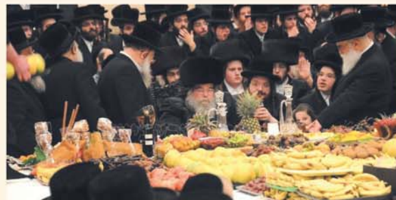
כ"ק האדמו"ר מבעלזא שליט"א בעת עריכת סדר טו בשבט