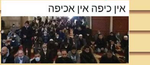
אין כיפה אין אכיפה

כתבה עוד חמישים שנה על דור שני לניצולי קורונה: מרואיין: תשמע, אצלנו בבית לא דיברו על הקורונה אבל זה תמיד היה נוכח, בשתיקות של אבא, בשטיפה כפייתית של הידיים. היו לילות שאבא היה מתעורר בבעתה וצועק 'שני מטר! זוז ממני! אמא דיברה על זה יותר, דיברה ובכתה.