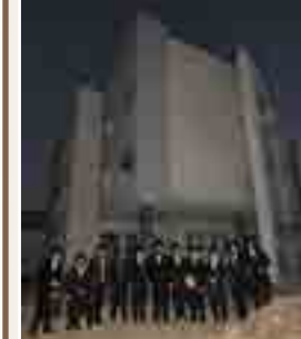
צוות המלמדים של הת"ת למרגלות בנין הת"ת החדש