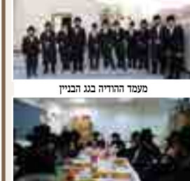
מעמד הוודיה בגן הבנין