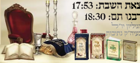
האלון נוסב אליו נאיתן: מורה בת נאימה - אלתר, יוסי וסמחה בת נאימה - אמת כהן בן אליו נאיתן מקראל בן אלו לנאספת