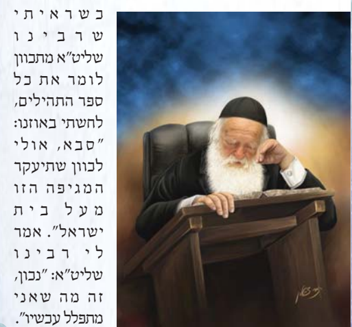
בשראית ישרבינו שליט"א מתכוון לומר את כל ספר התהילים, לחשתי באוזני: "סבא, אולי לכוון שתיעקר המגיפה הזו מעל בית ישראל". אמר לי רבינו שליט"א: "נכון, זה מה שאני מתפלל עכשיו".

רבינו שליט"א אומר כל יום פרק תהילים, חשבתי אולי כעת מעוניין לומר את הפרק היומי. אך לא: רבינו שליט"א פותח את ה'יהי רצון' לפני אמירת התהילים ומתחיל לומר את כל התהילים פרק אחרי פרק בסדר, את כל ספר התהילים! זה דבר לא מצוי ביום רגיל. בעשרת ימי תשובה רבינו שליט"א מקפיד לומר בכל יום את כל ספר התהילים, אך בימות השנה הרגילים זה דבר נדיר.