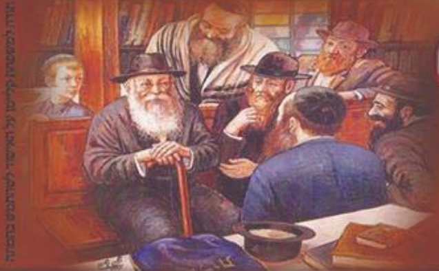
חזרה למסורת קיימת על הישגי לימודים במאות