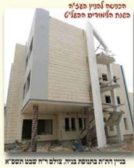
בניין התי"ת בתפנית בניה. צילם ר"ח שבט תשס"א

הגנים החסידיים לבנים שטפונשט אלעד מנהל חינוכי הרב מנחם וייס