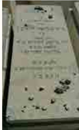
מצבת בתו חיה בלומא לוצקין ע"ה