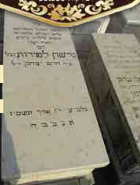
המצבה בהר המנוחות