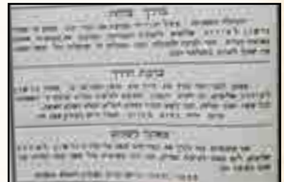
מודעות צאתכם לשלום שפורסמה במכ"ע לרגל צאתו לאר"ה

להשיב את רוחו, אולם לדאבון לב כל מעריציו ותלמידיו הרבים נצחו האראלים את המצוקים, ובאור ליום י"ז אדר השיב את נשמתו בטהרה ליוצרו, ע"כ מה שכתבו בקובץ אור עולם הנ"ל.