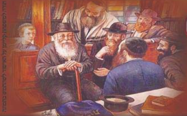
תורה למשפחה קיימת על האופי לישראלים במדינה