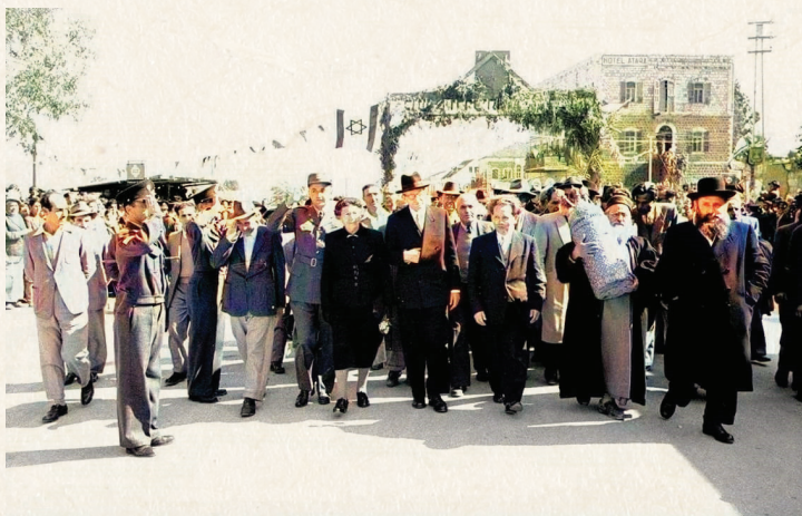
תהלוכת ספר התורה בשנת תש"כ