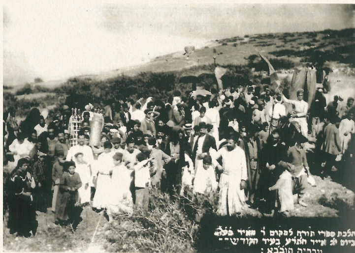
הכנת ספרו תורת למקום ר' מאיר פלג ביום 26 אייר ה'תש"ע בעיר הקודש - עברית תולכבא :