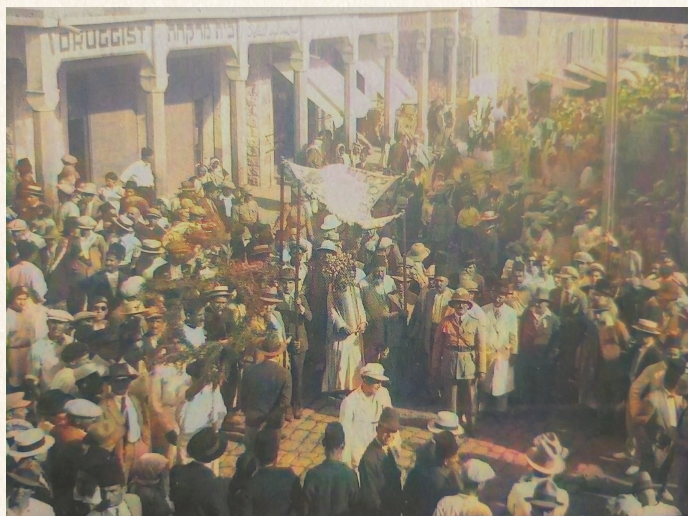
תמונה נדירה מתהלוכה לפני שמונים שנה