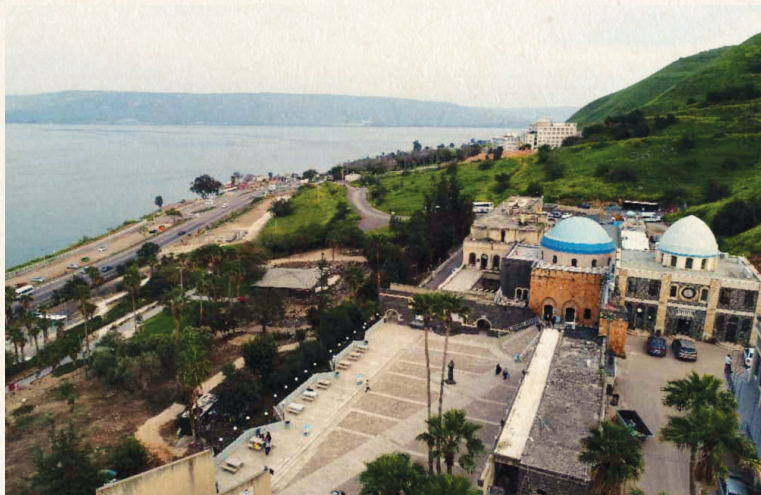
"הבו ערסי על כיף ימא"

מלשון הירושלמי (שם) "הבו ערסי על כיף ימא" מוכח, שרבי מאיר התנא הוא הקבור בטבריא על שפת ים כנרת. וספר טבור הארץ שציין כת"ר אינו מצוי איתי. עד כאן לשונו של הגר"ם מאזוז שליט"א.