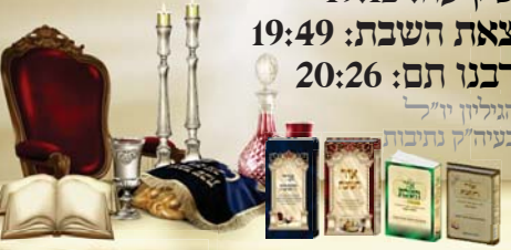
האלון נרכש לפני שנים: מנחה בת נשיאה - לקח לו וסמכה בת נשיאה - לבית כבוד וכן לפני נשיאת מקבאל בן אלו וסמכתה

כניסת השבת: 18:50 שקיעה: 19:12 ציאת השבת: 19:49 רבנו תם: 20:26