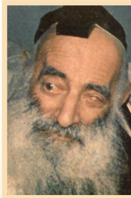
הרב מרעננה המקובל הרה"ק רבי יצחק הוברמן זצוקללה"ה

מהעולם, אין להם קונה ולומד, וכמו שמצינו בחוני המעגל בתענית, שקם בדור אחר, לא היה להם המשכה אליו. כמובן אין מונתי לספרים כללים כמהרש"א, דזהו כמו במלאכי השרת, שיש קיימים כמיכאל וגבריאל, ויש חדתינ נבוט לצפרא, ואחר כך חלפין, וכמו כן בספרים. אבל גם זה, לפעמים אחר כמה דורות בא גלגול אותן נשמות, ומבקשים ומדפיסים עוד הפעם אותו הספר, וכשתעיין היטב בזה, תראה פלאות התמים דעות, איך מנהיג העולם על ידי תורתנו הקדושה'. (בן לאשרי - ברכה משולשת פרשת קורח)