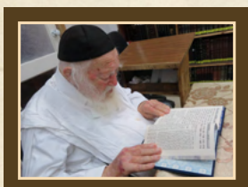
הגר"ח קנייבסקי שליט"א בלימוד ספר תהלים זרע שמשון