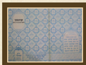
התימתו של הגר"ח קנייבסקי שליט"א על ספר תהלים זרע שמשון