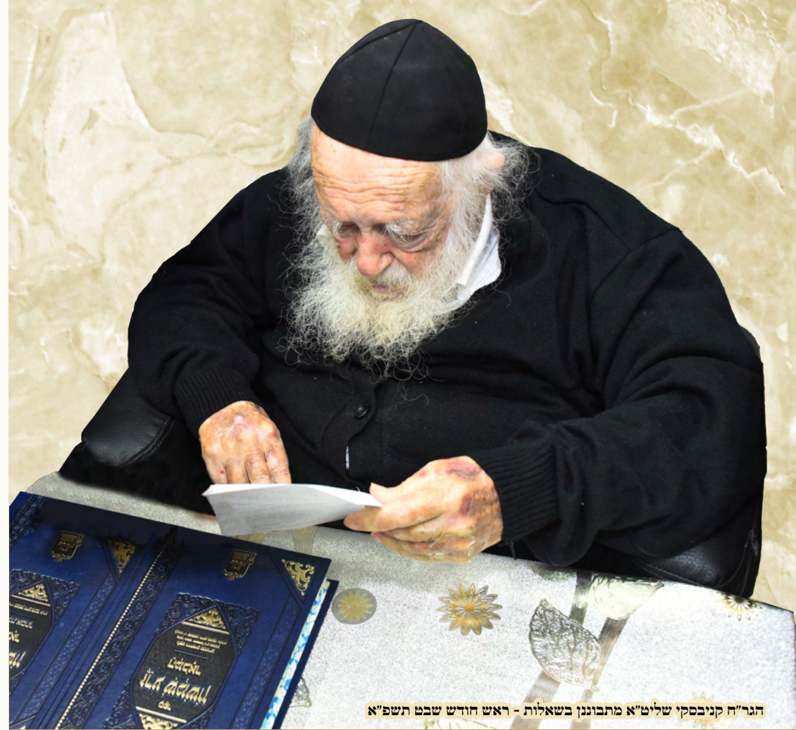
הגר"ח קנייבסקי שליט"א מתבוננן בשאלות - ראש חודש שבט תשפ"א