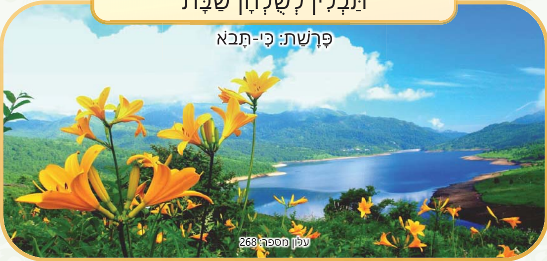
עלון מספר: 268

נא לא לקרוא בשעת התפילה וקריאת התורה. העלון טעון גניזה. הלימוד בשבת פי אלף מיום חול. כדאי לקרוא בשלחן שבת.