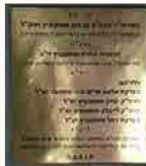
שלט ההנצחה בתוככי האהל שהוצב ביחמת נכדו מר שטאובר, תאריך ההסתלקות ציון בטעות לר"ח סיון

אני עזבת את העיר ש כשהייתי ילד קטן. את הסבא אני לא זוכר, אבל יש לנו תמונה של הביה"ח ביאס, יש שם הרבה קברים של יהודים