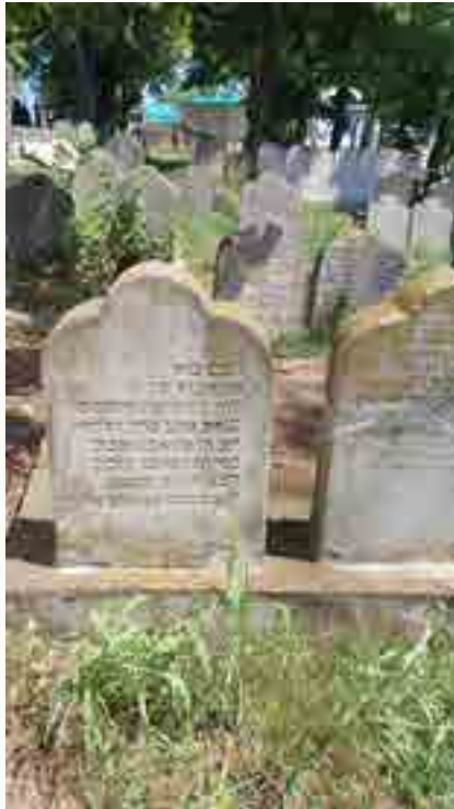
מצבות נספי ההפצצה הקטלנית של קהילת פודולואי בעיר יאס נטמנו בבית העלמין בסמוך לאהל האדמו"ר ומשפחתו הי"ד, בחזית אחת המצבות בחלקת הרובי הפצצה מתארת את האסון שפקד את נספי קהילת פודולואי ויאס ביום ר"ח אלול תש"ד

לפני שלש שנים היינו בבית החיים בפודולואי.