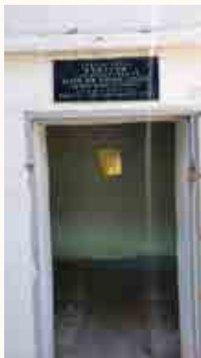
6 מצבות הנספים בהפצצה בתוככי האהל

חשכו פנינו, ותדמענה עינינו, הו! ביום זעם ומהומה, שטע אותך כדור מלחמה, יום בו פתאום נקטפת, נפרדת ואתנו עזבת, דכא רוחנו ונפשנו, לנצח נצור אמונתך אלינו