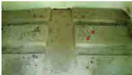
6 מצבות הנספים בהפצצה בתוככי האהל