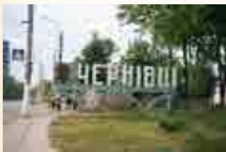
שלט הכניסה לעיר טשרנוביץ

הרה"ק רבי דוב בער אורנשטיין זצ"ל אבד"ק בויאן - חנו"כ בארה"ק בנו הגאון רבי מרדכי אורנשטיין זצ"ל מבויאן - טשרנוביץ נכדו הגאון רבי ישראל אורנשטיין הי"ד נספה בגטו טשרנוביץ די טבת תש"ב וחנו"כ בבית העלמין בטשרנוביץ אוקראינה מקום קברו לא נודע לע"ע