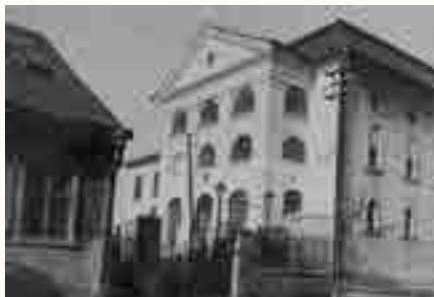
בית הכנסת של הרה"ק ה"באר מים חיים" הקיים עד היום בצ'רנוביץ'

הרבנית איטה - התחתן בבוקרשט כשהרבי מסקולען מוליך אותם לחופה במקום אביה, הרב ישראל אורגשטיין הי"ד שנספה בצ'רנוביץ'.