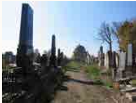
מראה כללי של בית העלמין טשורנוביץ כיום

לכבוש שוב - בניגוד לכל הסיכויים - את צ'רנוביץ עצמה ואת שאר חבלי בוקובינה וטרנסניסטריה. אבל עבור חלק מיהודי צ'רנוביץ, בה היו בשעת השחרור הסובייטי כ-25 אלף יהודים, שעוד לא גורשו, היה זה מאוחר מדי. מתוך כ-50 אלף יהודים ששוכנו בגטו צ'רנוביץ עם הקמתו, שרדו את מוראות השואה פחות רק מחציתם כ-25 אלף יהודים ששתו את כוס התרעלה עד תומה. רבים מהם איבדו את בני משפחותיהם מי במגיפה, ומי בחניקה ומי בסקילה.