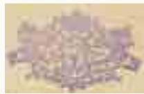
חותם הרה"ק רבי יוסף מרימנוב זצ"ל בו הוא חותם את שמו 'פרידמן' בהיותו שהתגדל אצל הרה"ק מרוזין