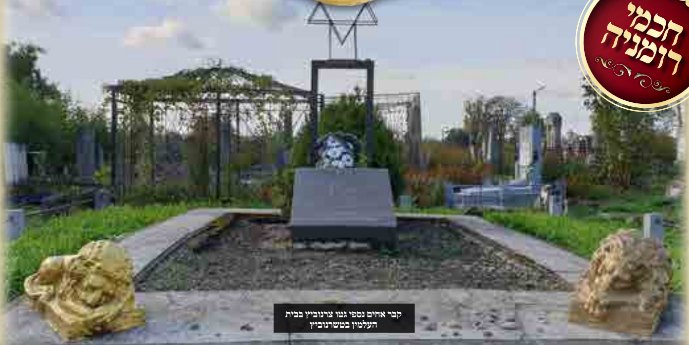
קבר אהים נספי גטו צרנוביץ בבית העלמין בטשרנוביץ

הרה"ק רבי דוב בער אורנשטיין זצ"ל אבד"ק בויאן - חנו"כ בארה"ק בנו הגאון רבי מרדכי אורנשטיין זצ"ל מבויאן - טשרנוביץ נכדו הגאון רבי ישראל אורנשטיין הי"ד נספה בגטו טשרנוביץ די טבת תש"ב וחנו"כ בבית העלמין בטשרנוביץ אוקראינה מקום קברו לא נודע לע"ע