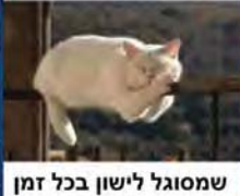
שמסוגל לישון בכל זמן ובכל מקום..

קחו את הגיל שלכם ותוסיפו לו 5. זה הגיל שלכם בעוד 5 שנים!