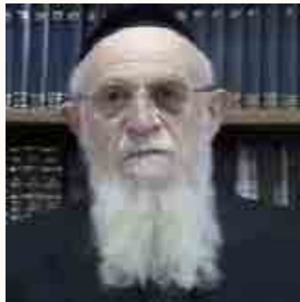
זכרונות שלא נס ליחם, השבוע כפי ששמענו מפי הרה"ג רבי אליהו דרמר שליט"א מירושלים

ממשיך לספר רבי נפתלי כהן: "אני התחנתתי כבר בארץ ישראל, לאחר שעליתי לארץ ישראל, אבל גיסי הגדול רבי צבי יוסף מיסקי זצ"ל שהתחתן עם גיסתו