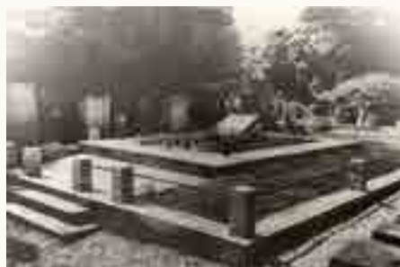
מצבת קבר אחים בטשורנוביץ לפי הרישומים טמונים כאן 837 יהודים שנרצחו עקב"ה בגטו טשורנוביץ בי"א המזוה"ת ש"א (6/7/41)

אלפי יתומים וחסרי בית נותרו בה בעיר המוכה שחוותה מעשי זוועה שקשה לבן אנוש לעכלם. גם אלו הנותרים, ניצלו בנס, שכן הנאצים זממו לחסל גם את כל הקהילה היהודית אך ההתקדמות המהירה של הצבא הסובייטי, מנעה מהם לממש את תוכניתם השטנית, אלו נפוצו לכל רוח, ניגפים לפני הסובייטים וליהודי צ'רנוביץ הייתה הרווחה.