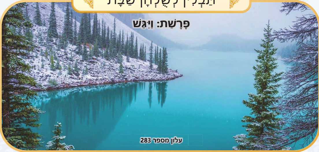
עלון מספר 283