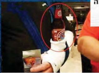
כשהרופא חבר שלך

לחשלוס: 655.31 טע"מ: 17% : 65.26 ש"ח חס ענאט 11 ש"ח לק"ג: 206.15 ש"ח בקניה זו שילמת 206.15 ש"ח לטובת שלמות הקואליציה בראשות מנסור ענאט