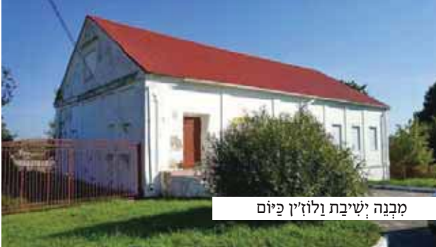
מבנה ישיבת ולוז'ין כיום

המום ומבלבל עמד התלמיד על מפתן האולם המפאר כשמחו תפוס בהרהורים; היתכן כי לכאן נשלח בידי רבו? היתכן כי עשיר זה שזכר בעליל כי אינו יודע מחסור מהו, יוכל ללמוד את גדר הבטחון וההשתדלות!?