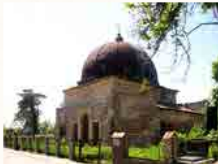
בנין ושער הכניסה לבית העלמין בטשורנוביץ