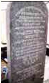
מצבת הרה"ק רבי יוסף הכהן פריעדמאן מרימנוב זצ"ל