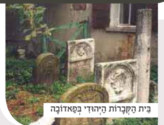
בית הקברות היהודי בפאדובה