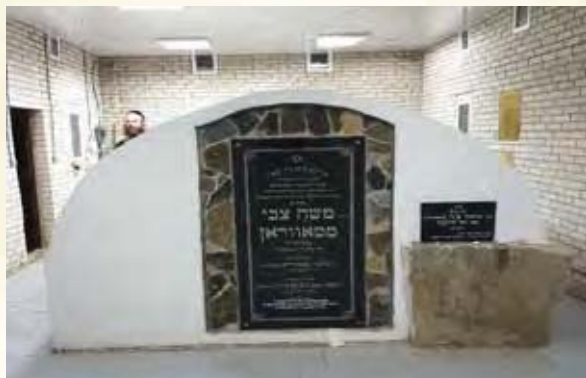
מצבת הרה"ק רבי משה צבי מסאווראן בטיטשלינק

שיש שמחה כשעובדים את הבורא ברוך הוא ויש עוד שמחה ששומח את עצמו במה ששמוח בעבודת ה'. וזהו הרמז בפסוק שוש, יש לי שמחה במה שאני אישי בה'. וזהו הרמז 'כל המענג את השבת נותנין לו נחלה בלי מצרים' (שבת ק"ה). כי כששומח עצמו בעבודת ה' יש לו שמחה גם כן במה ששומח עצמו בעבודת ה' ויש עוד שמחה מזה השמחה במה ששומח עצמו בשמחת עבודת ה' ויש עוד שמחה מן השמחה. וזהו עד אין סוף, ולכן נותנין לו נחלה בלי מצרים. קדושת לוי (ליקוטים)