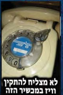
לא מצליח להתקין וויז במכשיר הזה