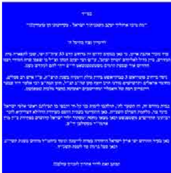
שלט הנצחה לבית הכנסת "זכרון יעקב שטפנשט" ברחוב קדם ביפו שפעל בין השנים תשי"ב-תשכ"ד