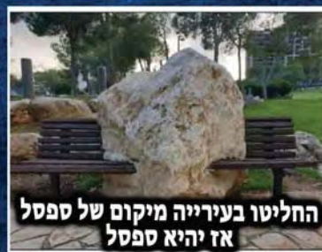
החליטו בעירייה מיקום של ספסל אז יהיא ספסל