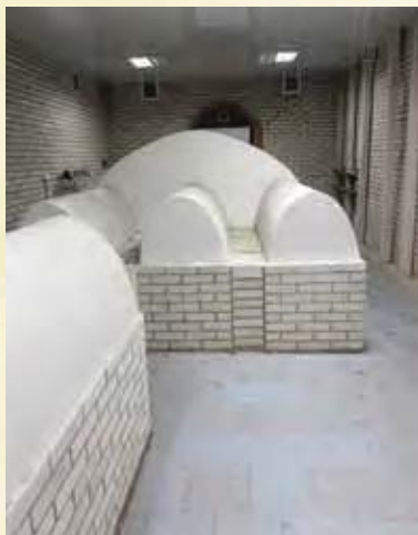
קברי צדיקי בית סאווראן בטיטשלינק מצידם האחורי

וענין מרן הס"ק מרוז'ין ז"ע ויאמר להרה"ק מסאווראן ז"ע 'מה השייכות של אריכות ימים, וכי באים לעולם כדי להתייבש כאן? והלא באים לעולם הזה רק לעשות ולהשלים מה ששייך לטובת נשמתו, וכשמשלימים