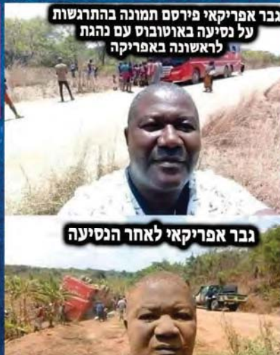
גבר אפריקאי פירסם תמונה בהתרגשות על נסיעה באוטובוס עם נהגת לראשונה באפריקה