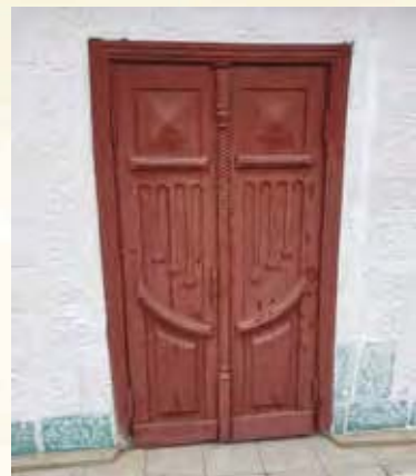
דלת הכניסה לביתו של הרה"ק רבי משה צבי מסאווראן זי"ע בטשיטשלינק

הקטגוריא ביניהם, - וסיים הרה"ק מטשארטקוב באמרו - ואבי זי"ע היה חד בדרא באמונת חכמים.