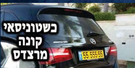
כשטוניסאי קונה מרצדס