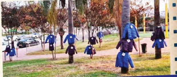
יש לכם סיפורים על אנשים או מעשים טובים שלחו לנו ונפרסם 367korona@gmail.com

נרצש לאור! התמונה הכי יפה שתראו היום היא של תורם אנונימי שפיזר מעילים חדשים בפארק באשדוד, לטובת מיעוטי היכולת.