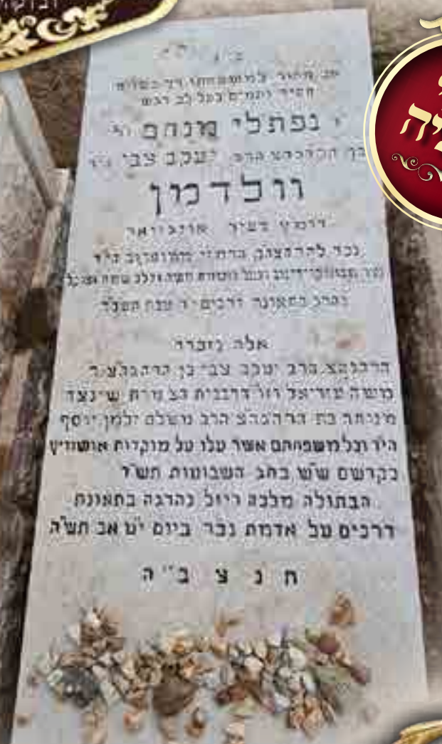
המצבה בבית העלמין זכרון מאיר בני"ב