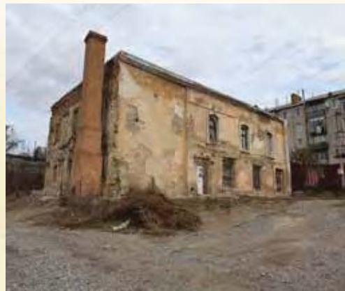
בית הכנסת של הרה"ק רבי משה צבי מסאווראן בעיר טשיטשלינק בשממנו