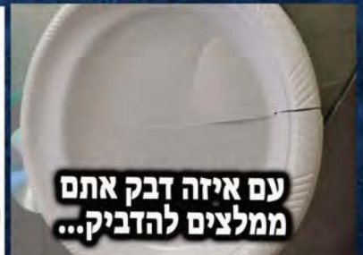
עם איזה דבק אתם ממלצים להדביק...