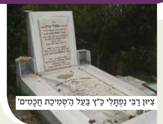
ציור רבי נפתלי כ"ץ בעל ה'סמיכת חכמים'

רבי נפתלי כ"ץ נולד בשנת ה"א ת"כ בעיר אוסטרצה שבאוקראינה לאביו רבי יצחק הכהן.