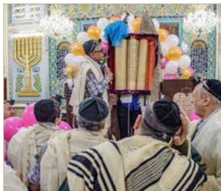
בית הכנסת יוסף אבאד בטוראן

הרב גראמי שיתף את העולם בתיעוד עכשווי מהחיים היהודיים באיראן. שיעור לבחורי ישיבה בשיראז, טקס חליצה, מבחן על הלכות שחיטה בבית כנסת באיראן, תמונות יפהפיות של בית הכנסת עזיז ובית הכנסת יוסף אבאד בטוראן ועוד. הוא מספר כי בטוראן פועלים