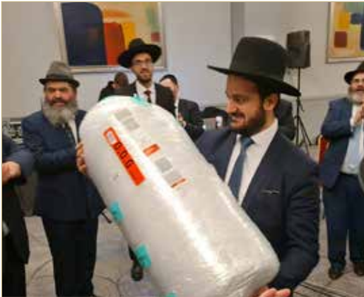
ספר תורה חדש במסעו לאיראן