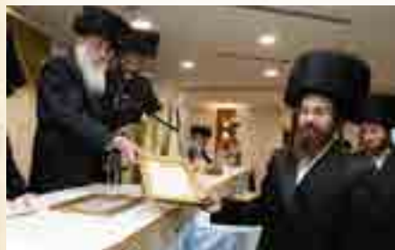
בחלוקת התעודות לרבני הכולל שליט"א