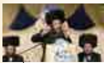
נואם הגר"ש שוורץ שליט"א רב ק"ק וראש כולל היסדא ב"ב

אנו עומדים כאן במעמד נורא של כבוד התורה ולומדיה, לכבוד האברכים החשובים שעסקו בלימוד מקצוע חשוב בהלכה, למדו ונתייעצו, חזרו ונבחנו, ואף שמשו לפני הרבנים הגאונים שליט"א בבתי הוראה, וכמו ששמענו כאן בדברים נפלאים ומתוקים ואמיתיים, ולפרש בשבח הדבר צריכים לשעה ארוכה, אבל הזמן קצר, ונפרש איזה ענין.