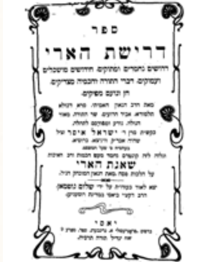
שער הספר שההדיר 'דרישת הארי' ונוסף קונטרס 'שאנת הארי' ובסופו 'דרישת יחזקאל'

3, בתר"ע הו"ל ספר 'תפארת בית לוי' תולדות זקנו הרה"ק רבי לוי יצחק מברדיטשוב, ונוסף 'תורת ישראל' לרבי ישראל מפינקוב בנו של רלו"י מברדיטשוב, ובסופו קונטרס 'תורת יחזקאל' לבנו רבי מתתיהו יחזקאל גוטמן. תשובות אליו: אבן שהם, קמה. מהרש"ם ח"א קלה, קסט, קט, רט, רי, ח"ב טו, סח. ח"ג שס, שעו. ח"ו ג, ד, ה, יב, פב, צב, צג, צד, צז, קסה,