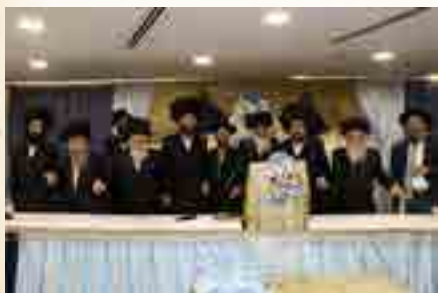
הרבנים שליט"א בריקוד של מצווה לגמרה של תורה

ויהי רצון שנוכה בקרוב לשמחה הגדול בבית הגואל, שיהיה אז ומלאה הארץ דעה את ה' כמים לים מכסים.