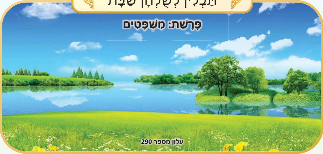
עלון מספר 290