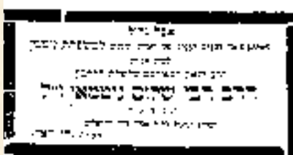
מודעת הנחומים של מערכת 'דיא וואך' בקיישוב עם הסתלקות רבי שלום מתאריך 15/2/1929

רי (בתר"ו), רכה, רלה, ח"ט ה, כ (תרס"ט), סח, סט, עג, צד, קי, קלא, קלה, קמט, קנט, קעו (לפעמים קוראו בשם גאטסמאן). מנחת פתים, אהע"ז סימן קמד סעיף ט (לה. א). פרי השדה, ח"ד כה. קובץ תורה מציון שנה ד חוברת ד, יט. בא בהסמכה: בנודע המצות (תרס"ח). חינוך הדת והודעת (תר"ט). דורות האחרונים.