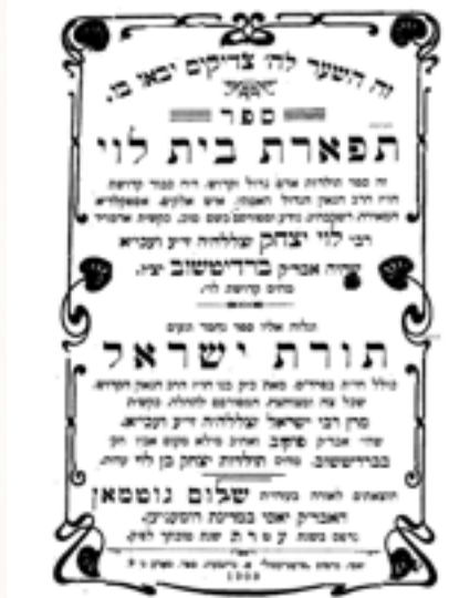
שער ספרו 'תפארת בית לוי' נדפס בתר"ע ובסופו 'תורת ישראל' ו'תורת יחזקאל'