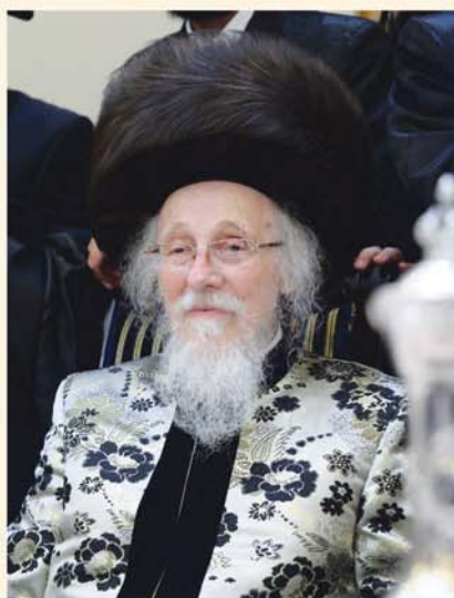
רבי יצחק אייזיק רוזנבאום כ"ק האדמו"ר מקליוולנד זיע"א

האברך, לימים כאמור הרבי מקליוולנד, מיהר לתפילת שחרית בבית מדרשו. בתום התפילה שאל את המתפללים אולי ראה מישהו את האורח שהיה כאן המשך בעמוד הבא