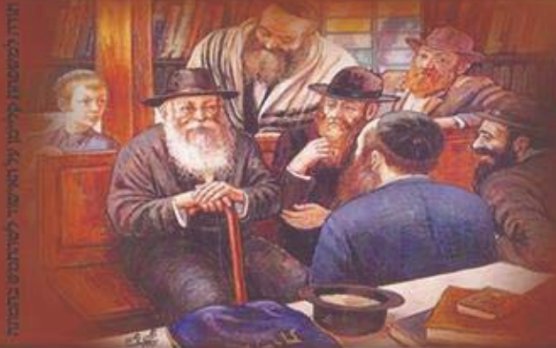
תורה למשפחה קייטן על הסיפור לפרשת במדבר