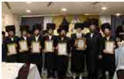
האברכים בקבלת תעודות ההוראה