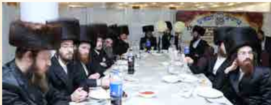
אברכי הכולל במעמד

מן החובה לציין בחשיבות האברכים, במשך הלימוד היו הזמנים הקשים, שהיה כמה וכמה שלא היה אפשר ללמוד בצוותא בדיבוק חברים כמימים ימימה מחמת גזירת הסגרים, ואעפ"כ לא מנעו האברכים עצמם משקידתם שעה אחת, והמשיכו בחזרה בכמה